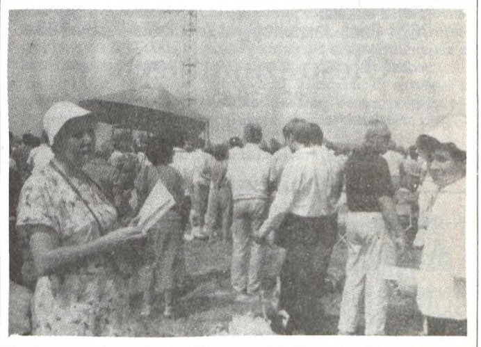
Képünkön pécsváradiak a pápai szentmisén.