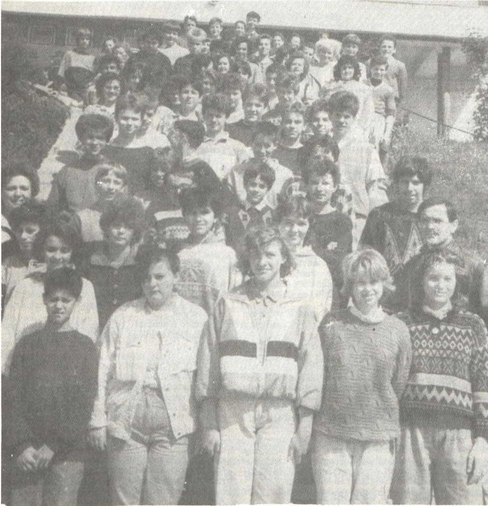
Jó indulást, sok sikert kívánunk a búcsúzó nyolcadikosoknak