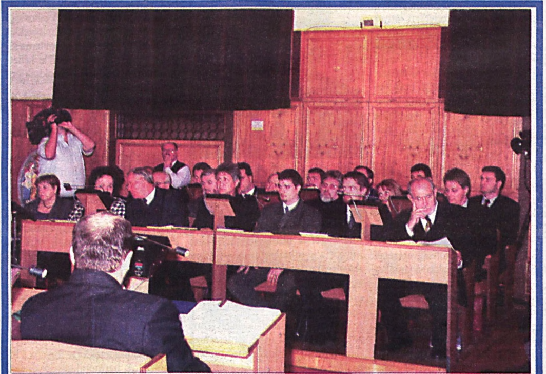
Képünk 2002. október 31-én, Pécs város Közgyűlésének ünnepi alakuló ülésén készült.