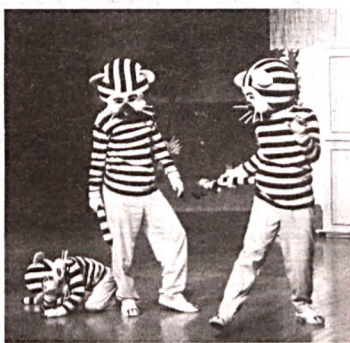
Az elmúlt évek legtöbb játszott gyermekelőadása A gyáva kistigris című zenés, maszkos játék volt a Pécsi Harmadik Színházban.