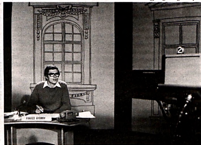
E sorok szerzője az Ablak első adásában 1981-ben.

lata. És mindezt átfogják, mintegy mágneses erőterbe helyezve őket az európai, sőt, globális méretű programokat sugárzó műholdas rádió- és televízió-rendszerek. Az egymással vitalkozó, versengő, egymást mégis kiegészítő, nemzetek feletti rendszerek globális búrja alatt a főszerp azonban mégis a mindennapi életet segítő, úgynevezett „kis”, helyi híreké maradt...”