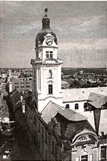
PÉCS MEGYEI JOGÚ VÁROS ÖNKORMÁNYZATÁNAK LAPJA