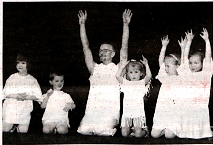
A legkisebbek mozgásművészeti órán

A tánc alapjait a fizikusi diploma megszerzése után Jeszenszky Endrétől sajátította el, akinek 1983-1985. között növendéke volt. Mesterét a modern dzsessztánc-rendszer kialakítójának tartják, ezt követte Rovó Attila is. Az Európa-hírű táncművész, koreográfus, balettmester mondta Rovóról, hogy nem tornász, inkább táncos lába van. Talán ezért is tartott ki a tánc mellett. Az artistaképzőbe is beleszótolt 1984-ben, ahova fél évet járt. Büszkén állítja, hogy ott is nagyon sok olyant tanult, amit napjainkban is hasznosítani tud. Harmincegyéves volt, amikor feleségét Pécsre helyezték egy új munkahelyre. Rovó Attila tanult szakmájában a Mecseki Uránbányánál helyezkedett el kutató mérnök-ként, majd az ÁNTSZ Baranya Megyei Intézetében sugárfizikusként dolgozott hat éven keresztül. Az ércbánya bezárása után megszűnt a munkaköre a tisztiorvosi szolgálatnál. Ma már csak az Ifjúsági Házban dolgozik, ahol tizenkét éve, Pécsre érkezésekor kezdte a tánc tanítást. Nagy ritkán mohácsi, harkányi, széksárdi felkéréseknek is eleget tesz, ahol csoportokat oktat a