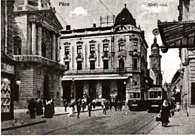
Jobbról a Nemzeti Kaszinó bejárata, szemben a Vigadó, a régi bálók fő színhelyei

A nyitás minden évben a hagyományos kaszinóbál volt. Ezt követte a szintén hagyományos jogászbál. Ezek voltak a legegészségesebb bálók, de a társadalom minden rétege, a polgári szakmák minden ága, a különböző szervezetek megtartották táncos ösz-