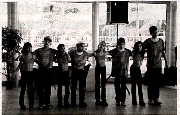
Oroszlánkörmök tánc csoport

techno zene következtében gépies lett - mondta Rovó tanár úr. - Valamikor a diszkóba járok adtak táncos tudásukra, figyeltek a zenére és TÁNCOL-TAK, ma már ez nem mondható el. Nálunk az IH-ban négy és huszonnégy év közöttieket tanítunk. A szalon-táncról az egyedi táncokig. Az első Pécsi Napokon tanítványaim mazso-