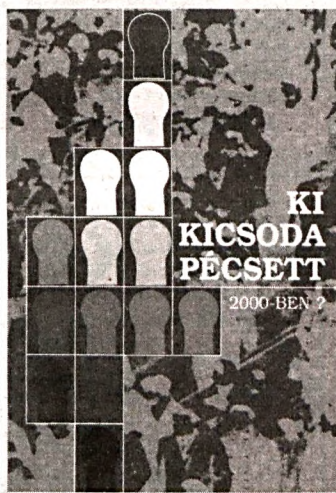
Ki kicsoda Pécsen 2000-ben? című könyv az alábbi helyeken vásárolható meg: Déli Extra szerkesztőség: Pécs, Bajcsy-Zs. u. 35., Írók Könyvesboltja: Pécs, Király u. 21. Széchenyi Közgazdasági és Jogi Könyvesbolt: Pécs, Rókus u. 5.