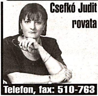
Telefon, fax: 510-763