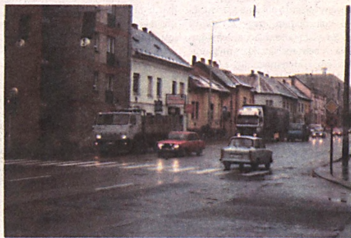
A 6-os út csöndes percei

- Igazából bűn betönni ezeket a gödröket - mondta G. barátom, a nagy vadász. - Ha így hagynák őket, tele vízzel, hamarosan megtelepednének bennük a vadkacsák. Én pedig fölmászniük magasleest építeni a Hullám kerítésére, s csak lőném őket. Még a nejem sem háboroghatna bizalmatlanul, amiért vadászatokkor mindig távol vagyok.