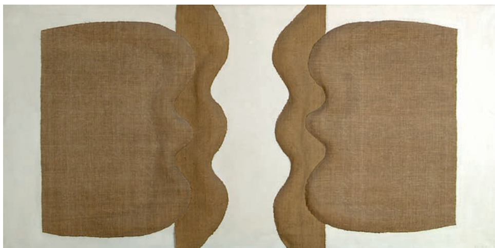
Kettős forma, 1969. Modern Magyar Képtár, a művész ajándéka