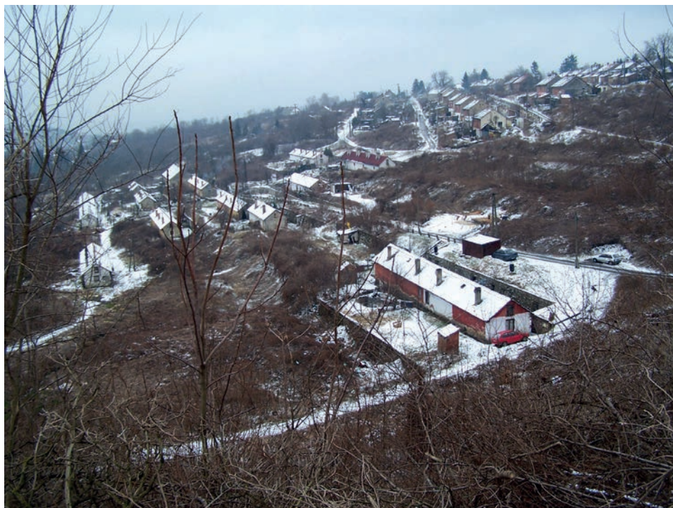
A György-telep 2011-ben, jobbra a Felső-telep

korszerűsítése az alsó térszinten álló, volt legényotthoni épület lebontásával kezdődött. A Felsőtelepi iskola 1997-ig, előd iskoláinak jog- és szellemi örököseként is, háromnegyed évszázadon át magas színvonalon, eredményesen szolgálta önálló iskolaként bányász generációk ifjúsági nevelését. (Hajdani tanulójaként is tisztelettel és hálával adózom emlékének!)