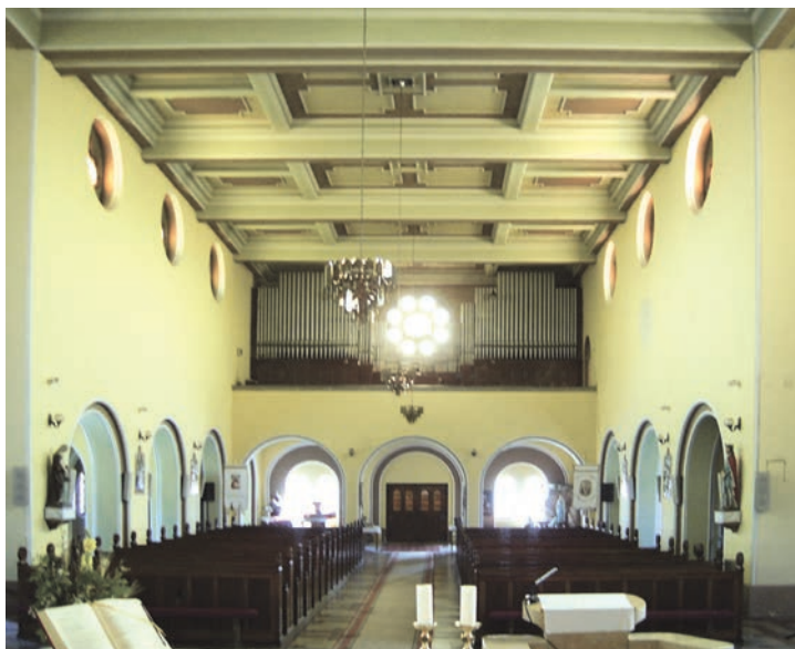
Főhajó a karzattal

lág nemcsak a formaképzésből, hanem a bőséges fénymennységből eredendően sem emlékeztet a középkori román templomokban uralkodó hangulatra. A szentélybe három kerek ablak nyílik. A kereszthajók külső homlokzatait egy-egy, a nyugati homlokzaton is látható hatalmas rózsablak foglalja el. A kimagasló főhajó mindkét oldalfalán négy-négy kisebb rózsablak árasztja a fényt. A mellékhajók megvilágítását a déli oldalon, a belső térszakaszoknak megfelelően, háromszor hármas, az északin kétszer hármas csoportosításban szereplő íves keskeny ablak látja el, mert itt, a harmadik ablakcsoport helyén, a templom oldalbejárata nyílik. Az ablaktáblákat 1988-ban színes üvegekre cserélték. A nyugati nagy rózsablak közepének Szentlélek-galambot ábrázoló üvegfestményét Palka József budapesti üvegfestő készítette 1936-ban. 10