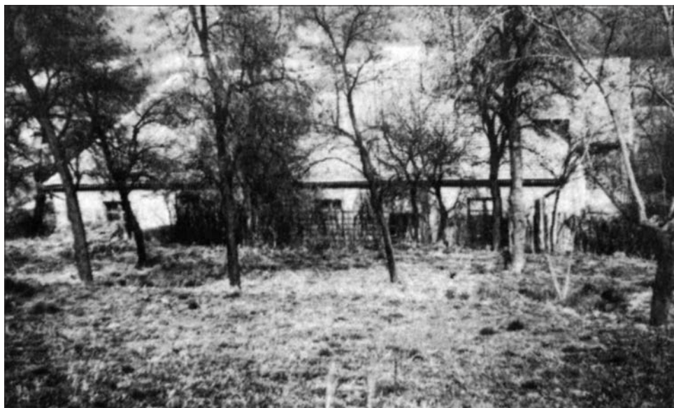
A György-telepi iskola épülete a kertek felől