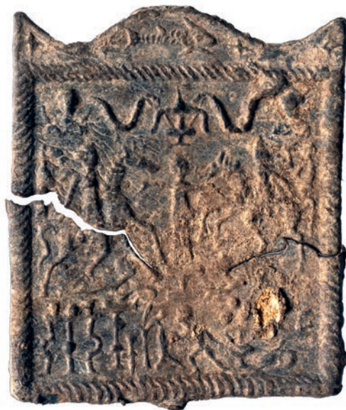
Dominus és Domina-tábla

90x77x3 mm méretű, 110 gramm súlyú ólomötvözetből készült szemközt reliefes, hátul sima táblácska. A nagyjából fele-fele arányban ólomötvözetből, illetve kőből készített tárgytypusból birodalom-szerte közel ezer példány ismert. A rendkívül összetett ikonográfiával rendelkező táblácskák által is adatolt irányzat a Közép-Duna vidéki tartományok egyik jellegzetes, őslakos, feltehetőleg illyr eredetű romanizált kultuszformája volt. A táblácskákat korábban, a jobb híján csak szakirodalmi elnevezésként létező Dunai Lovas-istenek kultusza emlékanyagának vélték, egy újabb adat alapján viszont a Közép-Duna vidéki feliratos anyagból is jól ismert Dominus és Domina istenpár tiszteletéhez kötődnek. A Pécssett talált példány, néhány pontos párhuzama alapján Dél-Pannonia–Inferiori, Sirmium környéki kötődésű. A táblácska sopianae-i előkerülése önmagában nem utal helyi szentélyre, hiszen szállítható volt. Pécs környékéről, vagy inkább Baranya megyéből több hasonló vált ismertté már korábban. Kidolgozásuk, anyaguk egymástól eltérő, ami a tartományon belüli, de különböző épített szentéllyel rendelkező helyekről való eredetükre utalhat. A megye területéről, ami szükségképpen egybeesik az egykori Sopianae territoriumának legalább egy részével, a fent bemutatottnaknál jóval több római kori lelet ismert, amelyek a fentihez hasonló elemzések tárgyát képezhetik.