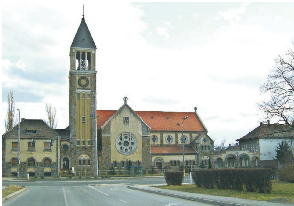
A templom észak felől

Pécs címerét ábrázoló, K. Nagy Mihály által hasonló anyagból és formában készített dombormű helyezkedik el. Az ívmező szélein stilizált gyárépület együttese, illetve a gyárvárosi templom északi nézete látható lapos domborműben. A torony nyugati oldalán félköríves, kockafríz-béltetes keretben a szerb megszállás alól felszabadult város hálaemlékét látjuk. Felső részén az angyalos magyar kiscímer, alatta fehér márványba vésett, háromszor két sorba szerkesztett kronosztikonos latin szöveg szerepel. A római számok összege az 1927-es évszámot adja, tehát a templom alapkőletételének évét jelöli. 9