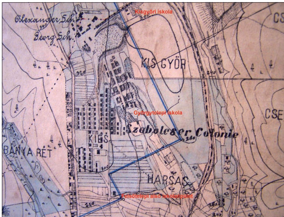
Térkép a 20. sz. első évtizedéből, Szabolcs-bányatelepről

az 1870-es években vett nagyobb lendületet (az 1880–81-ben készült 3. katonai felmérés térképe szerint 24 épület állt), és az 1920-as években fejeződött be. A felsőtelepi iskola elkészültével (1922) minden közhasznú intézmény már a Felsőtelepen működött, Rigliben csak az alacsonyabb színvonalú lakások maradtak.