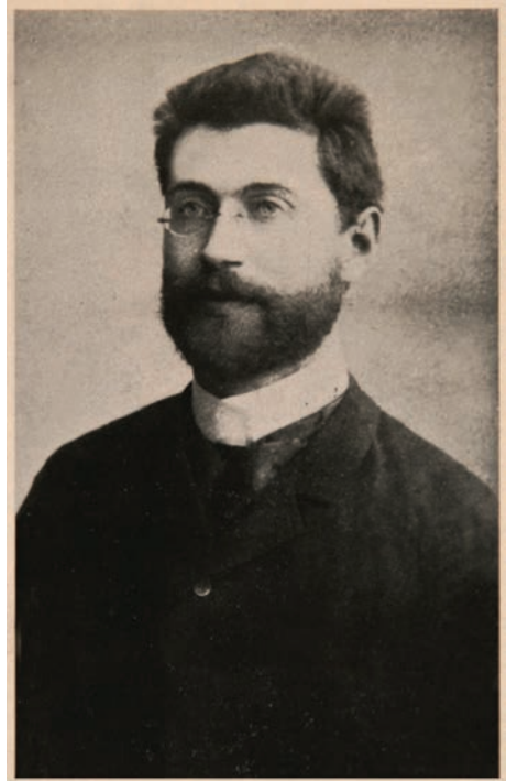
Vikár Béla, az 1889-i finnországi gyűjtőútja idején

tok, melynek kulcsa a népköltés” – írta. „Mindent, ami őt meghatja, mindent, ami fáj, vagy örömet okoz neki, dalaiba önti bele, s csak dalait kell megismernünk, hogy ezt az egész érzésvilágot lelkünk világává össze tudjuk olvasztani.” 24