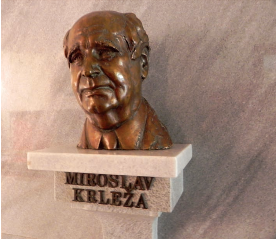
Rigó István: Miroslav Krleža szobra a róla elnevezett horvát iskolában (Szigeti út 12.)

Latinovicz hazatérése (Povratak Filipa Latinovicza) című regénye egy végzetesen sebzett lélek története, 58 Az ész határán (Na rubu pameti) pedig negatív fejlődés-regény, 59 amelyet Bori Imre „a legkomorabb Krleža-szövegnek” nevezett. 60 Életművének centrumában egy sokrétű, nagy ívű családtörténet elevenedik meg. A Glembay család sorsa a horvát polgárság hanyatlásának látomása. Analitikus szerkezetű drámatrilógiájából is ez a vízió tárul elénk. A Glembay Ltd (Gaspoda Glembajevi) Ibsen és Freud hatására elfojtott szenvedélyek pusztító erejű feltörését mutatja be, az Agónia (U agoniji) dialógusaiban a három főhős élveboncolása zajlik, a Léda (Leda) pedig két házasság krízisét mutatja be a szerelmi háromszög (valójában ötszög) motívumának groteszk-ironikus felhangjaival. 61