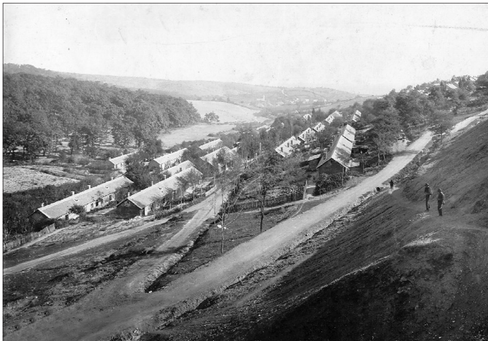
A György-telep a 20. sz. elején

A Dick György telepnek nevezett Judenburgra is igaz az, ami György-telepre. A köznyelvben senki nem hívta Dick-telepnek, a neve megszűnéséig mindenkinek csak Judenburg maradt. Felszámolására a külfejtési munkák során került sor, a lakások kötelező pótlása a városban történt meg. Az „alsó” Dick-telep a Ferenc József aknai védőpillér lefejtésével kapcsolatosan szűnt meg.