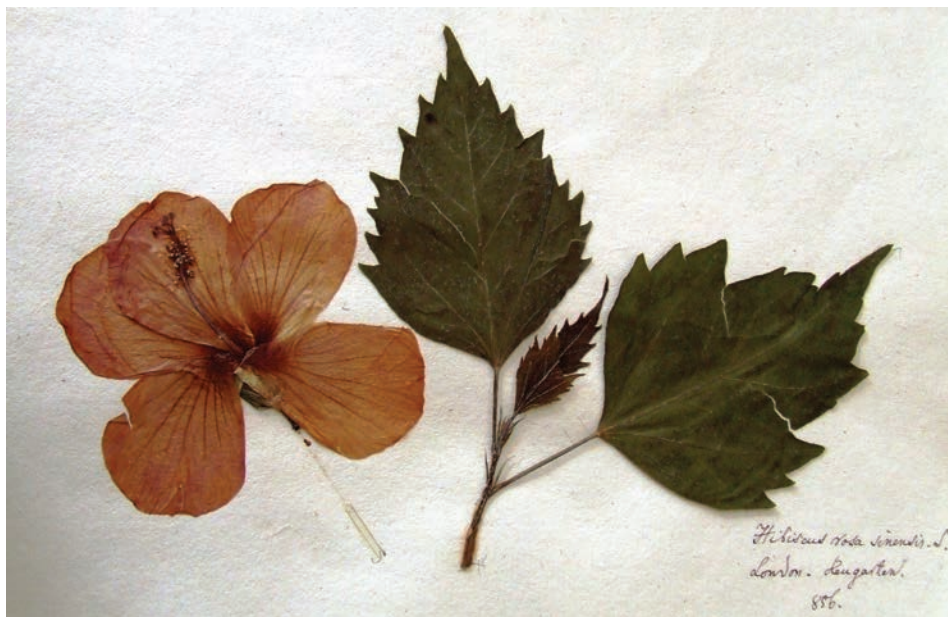
Hibiscus rosa sinensis L. London Kew garden 856.

Nagyon jól felépített, részletes és jól érthető írásokról van szó. Önmagában is remek forrása lehet botanikatörténeti kutatásoknak. Az általa példaként leírt növények nagy része megtalálható híres herbáriumában, és egy külön kötetben, rendszerbe sorolva. Ezen jegyzetek alapján írta meg legismertebb tanulmányát, a Pécsi Ciszterci Főgimnázium 1858/59-es évkönyvében, Die Flora des Fünfkirchner Pflanzengebietes (A Pécs környéki növényterület flórája) címmel. Részletesen írt a környék klímájáról, Észak-Itáliához hasonlítja, illetve szólt a hegyvonulatok jótékony hatásáról, aminek köszönhetően szabadban megterem ezen a vidéken a mandula, a birs, a füge és a szelídgesztenye. Ugyanebből kiindulva megfigyelte bizonyos fák lomb- és virágbontási idejét. A baranyai növényállomány változatosságára rámutatva megállapította, hogy sok olyan faj él itt, amely máshol ritka vagy teljesen hiányzik. Májer Móric 1565 növényfajt tartott számon a környéken, köztük 50 olyan fajt, amely máshol kifejezetten ritka, és 52 olyan fajt, amely a pesti flórából teljesen hiányzik. Leírta az is, hogy az itteni növényállomány és a rovarállomány mindenképpen kapcsolatban lehet egymással, és hogy a baranyai flóra igen jelentős részét képezik a különböző díszkertekben termesztett növények.