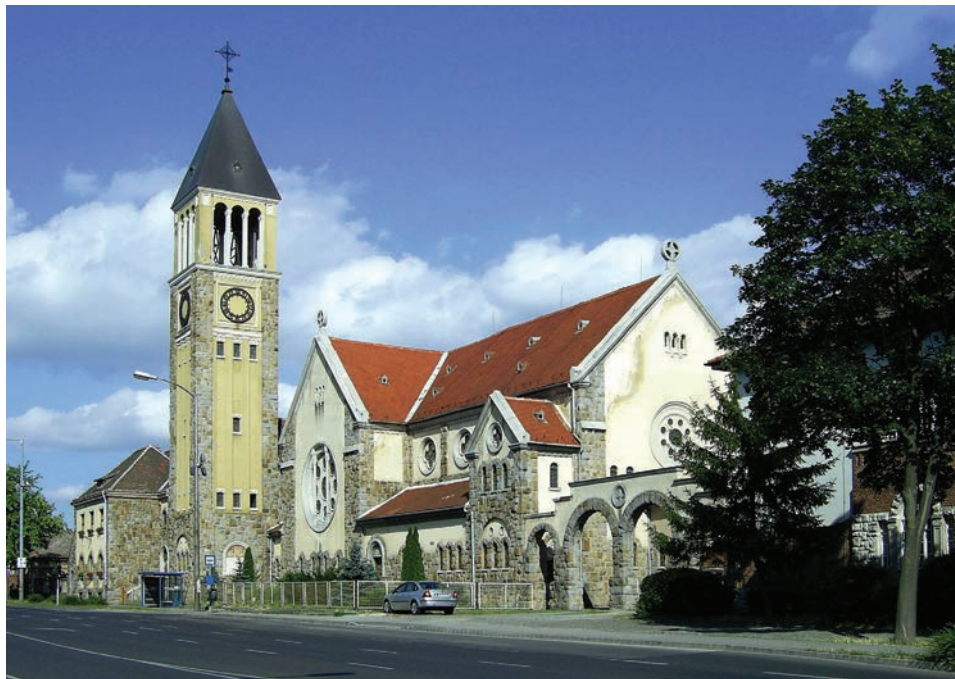
A templom nyugat felől

hajók végeinek oromfelületein hatalmas rózsablakok láthatók. Az északi oldalnak kettős profilú keretsávjába két vékony oszlop illeszkedik.