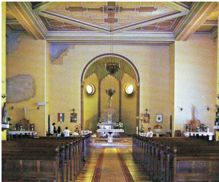
Főhajó a szentéllyel

Bal oldalfalát két román törpeoszloppal három ívnyílásra osztott oratóriumablak töri át, amelyek közül a tágasabb középső, a szentély falsíkjánál mélyebben helyezkedik el. A diadalív az ívnyílás bélletének szélességét meg nem haladó, fejezetes, márványozott fél-oszlopokból, s ezeken támaszkodó boltívű egyszerű ívhevederből áll. A diadalívtől kiszélesedő fal sima felülete a sarkok törése után a középhajó szélességében indul a kereszthajóig. Ezen a szakaszon nyílik a sekrestye bejárata, illetve az ellenkező oldalon ennek megfelelő íves falmélyedést alakítottak ki. A szentély egy lépcsővel magasabban fekszik az előtte kialakított trapéz alakú széles liturgikus térnél, amely viszont két lépcsővel haladja meg a hajó padlószintjét.