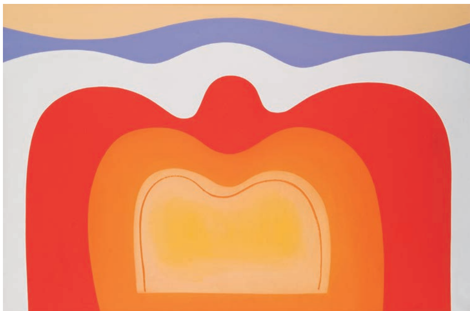
Sírkövek, 1968. Modern Magyar Képtár, a művész ajándéka