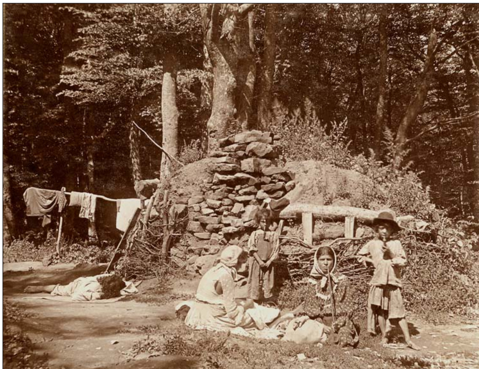
Cigányasszonyok és gyerekeik egy mecseki erdei telepről

vonalát követve a délre fekvő Stadtwald, azaz a Nagybányaréti völgy bányászkolóniáinak szemközti oldalán alakítottak ki újabb vályogputris közösséget. A két világháború közti korszakban jött létre a már említett györgytelepi kolónia kb. 15 putrival és a lantos-völgyi telep valamivel nagyobb putri- és lélekszámmal. Mindkét településen élő cigány férfiakat már a környező bányák foglalkoztatták, akár a forrásokban sokat szereplő Majális téri telep lakóit is. E kolónia közvetlenül a Komlói út mellett létesült a 40-es években, s folyamatosan terjeszkedett.