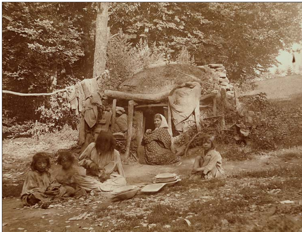
Teknővájó család a két világháború között egy Mecsek környéki kolónián