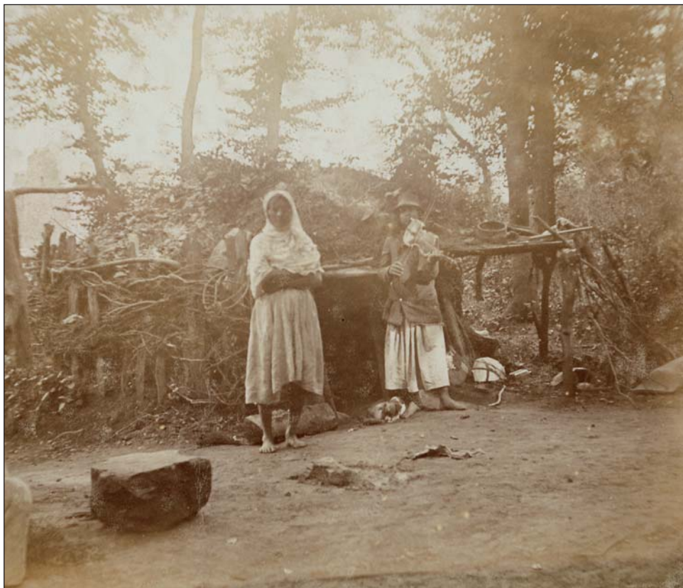
Cigánytelep valahol a Mecsekben, 1945 előtt

koldulásra, a munkakerülésre és a lopásokra tanítják. Veszélyes ezen emberek magatartása arra is, hogy a köznyugalmat nagymértékben zavarják, mert még a munkásság üzemben, mezőn stb. dolgozik, építi hazánkban a szocializmust, addig ezek a személyek besurranó lopások, betörések stb. révén dézsmálják meg a becsületesen dolgozó, de nem utolsósorban a szocialista szektorok személyi és tárgyi vagyonait.” 10