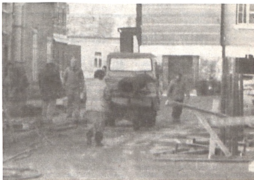
Megkezdődött az „Átjáróhid” beépítési munkálata. Iroda, étkező, pihenő kerül kialakításra