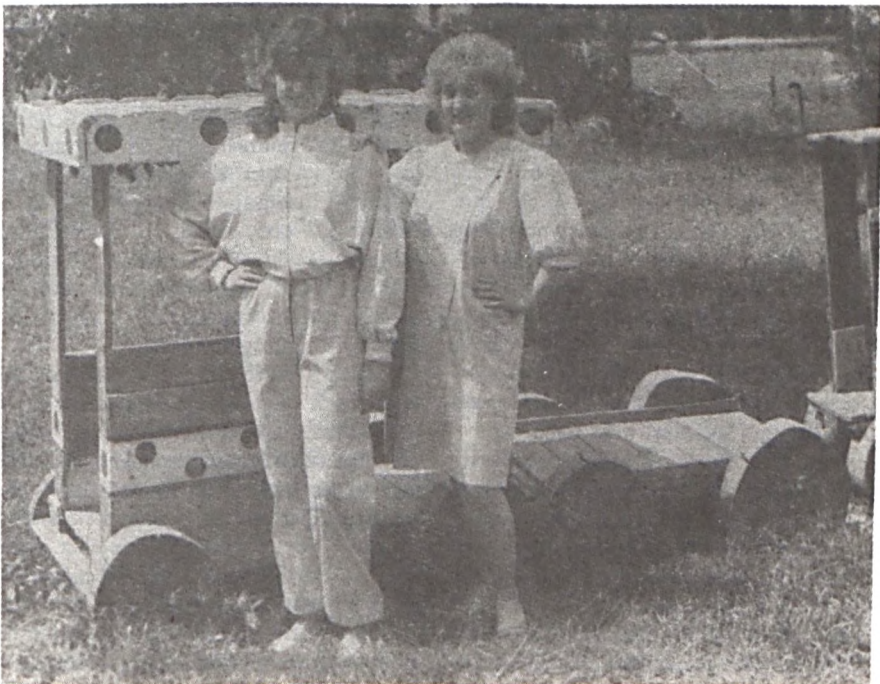
A varrodában elkészültek az első munkaruha nullszériák