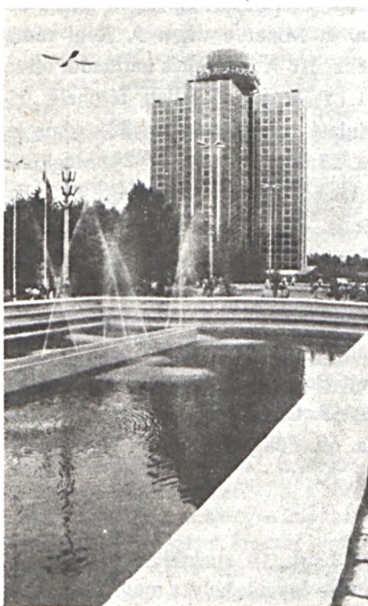
Tavaszi BNV, a beruházási javak vására