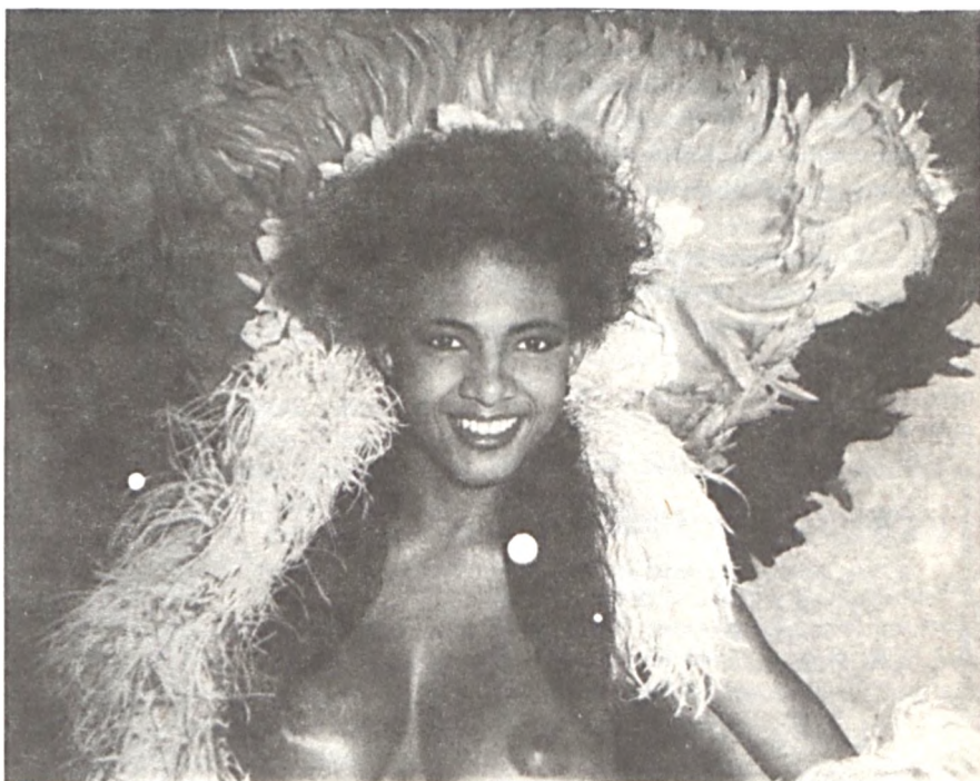
A fotó ugyan Rióban készült, de annyi közünk van hozzá, hogy a képen látható hölgynek Soplanac-t ígérték meg Nívót. A 4-5. oldal végén jelezzük...