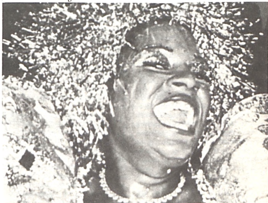
Az első oldalon jeleztük... Úgy tűnik, megkapta!

— Ne tréfáljon! Gondolja, hogy azok majd fizetnek?