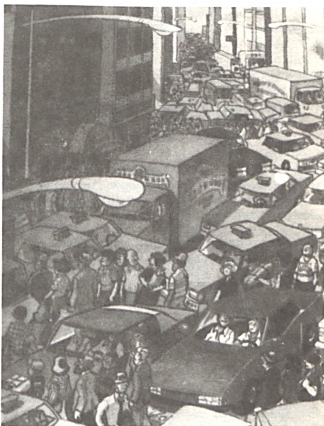
Az én kocsim legnagyobb előnye, hogy 4 másodperc alatt benne van a szásban...