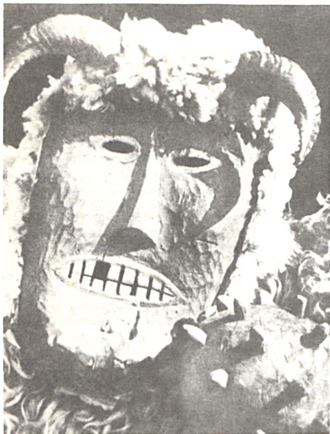
Bemutatjuk új munkatársainkat: mohácsi mintaboltunk vezetője