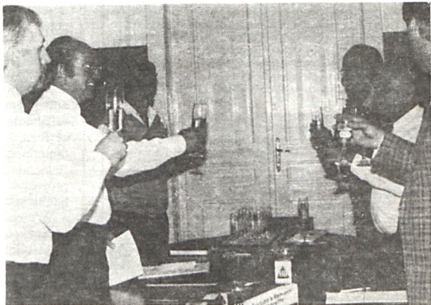
A B. A. T.-val kötött licence-szerződés aláírását követően a felek az együttműködés sikerére koccintottak

jellemzi. Füstszűrője igen vékony szállínom-ságú acetátkábelből készült acetátfilter. Dohányösszetételét tekintve amerikai blend típus, mely 25% burley-dohányt tartalmaz, kellemesen aromásított. Erősségét tekintve hova sorolhatjuk? Nem tartozik a leggyengébb cigaretták közé, kátrány- és nikotintartalmát tekintve az „ős” Sopianae és „gyermekci”, a Lady és Junior között helyezkedik el. Füstjé-