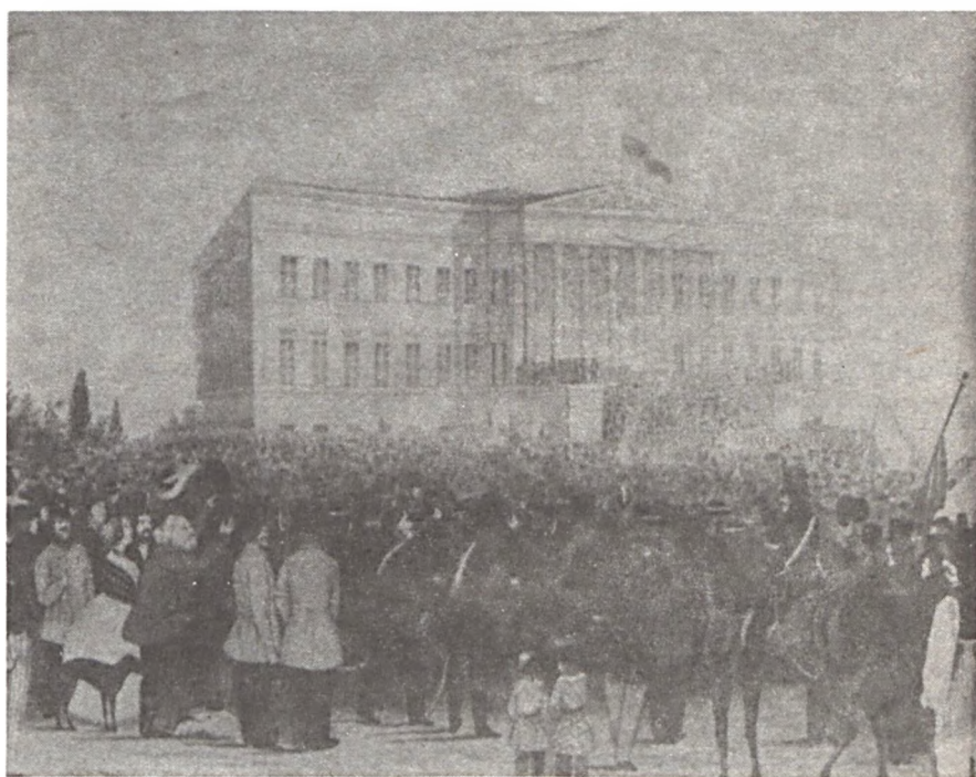
1848. március — a Nemzeti Múzeum előtt

Napirenden kívül a VT megkezdte az új VT megválasztásának technikai előkészítését.