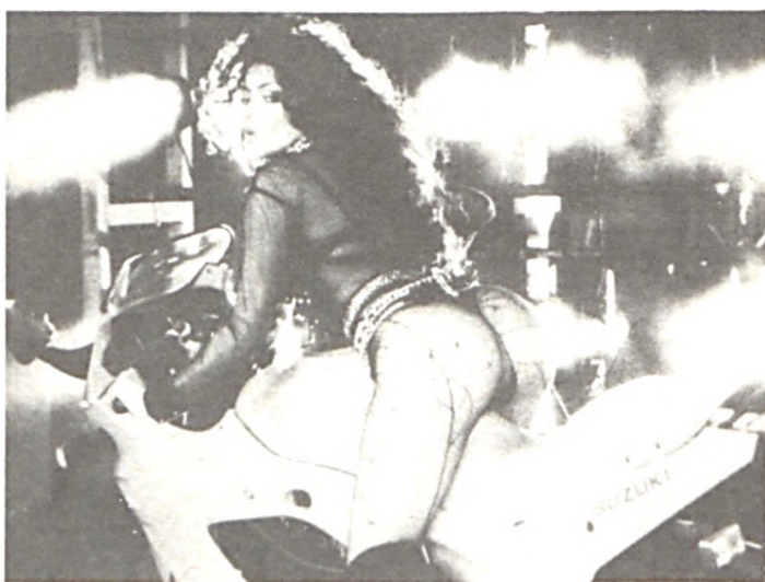
Ez is aktuális. Ezen a fotón tényleg far-sáng van.