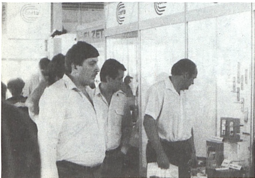
Nyitott szemmel járta az őszi Budapesti Nemzetközi Vásárt kollégánk: beszámolóját tapasztalatairól lapunk 3. oldalán közöljük.