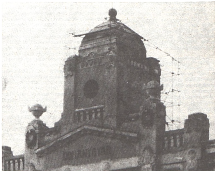
A gyártási épületen lévő kupola lassan visszanyeri eredeti szépségét