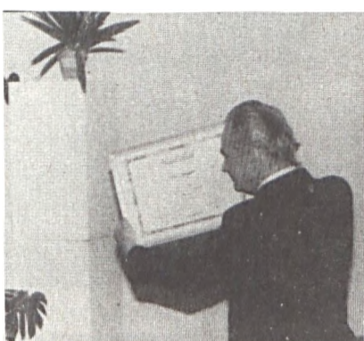
Vállalatunk igazgatója a Dicsérő Oklevéllel