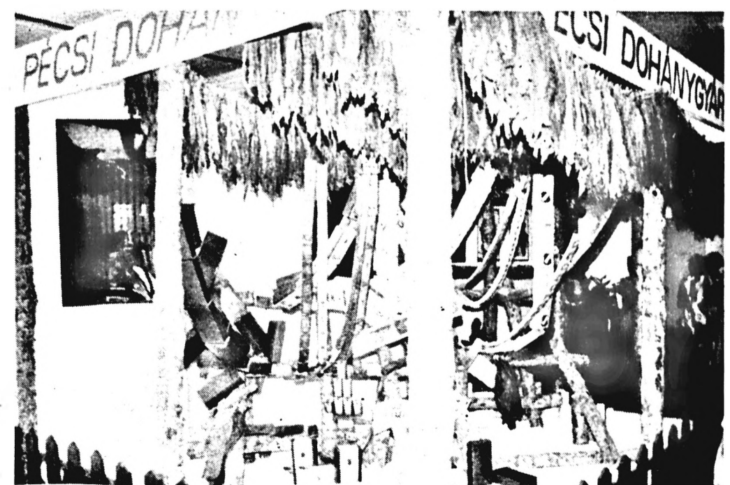
Látványos, gazdag volt az idei, most 110 éves Szegedi Ipari Vásár, amelyen természetesen bemutatkozott a Pécsi Dohánygyár is. (Tudósításunk a 3. oldalon.)