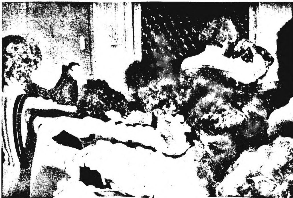
Az elmúlt hónap végén ismét jól sikerült Centrum-vásárlási napot szervezett a szakszervezet a KISZ-klubban. Érdeklődőkben nem volt hiány.