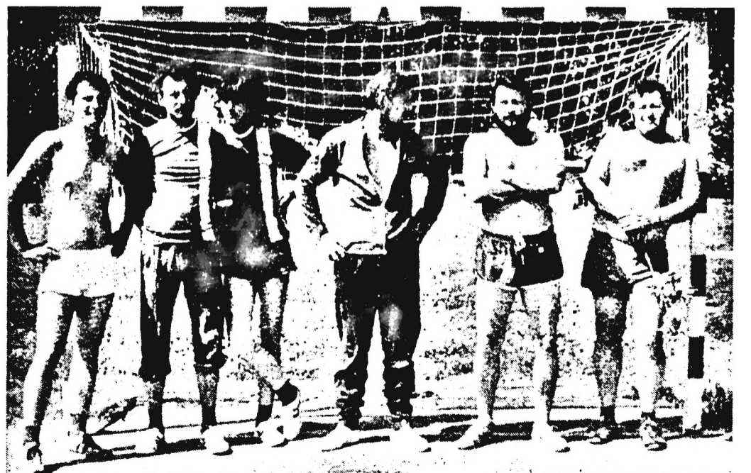
A brigádok közötti házi focibajnokságot május 27-én rendezték meg. Képeinken a tmk csapata.