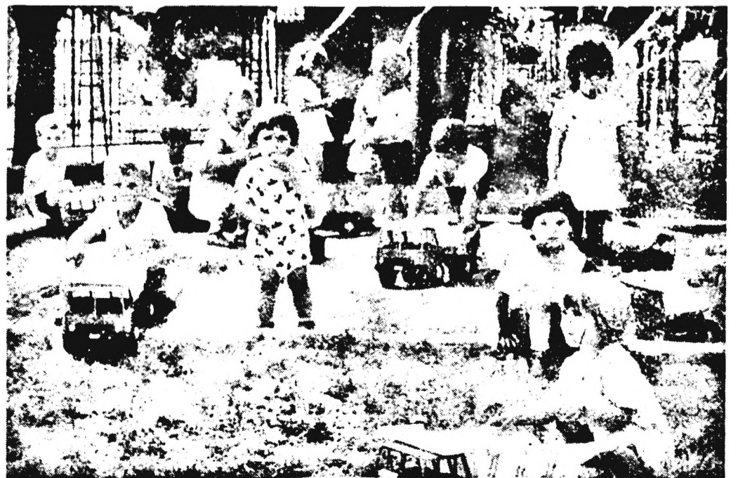
Május 23-án az óvodások a feldiszített udvarban ünnepeleék a gyermeknapot. Itt még a picik szemmel láthatóan „várakozó” álláspontra helyezkedtek.