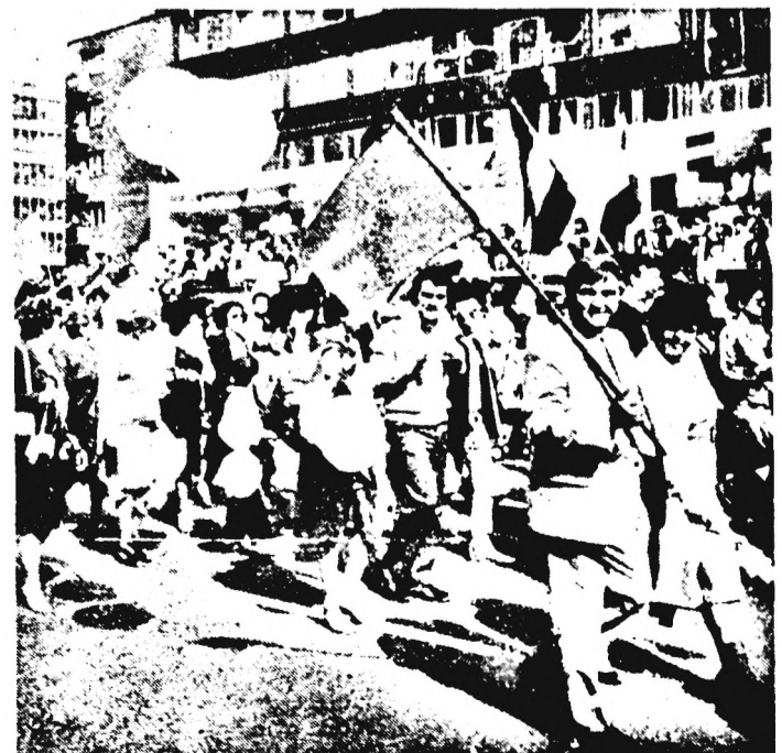
Vidám hangulatú, színpompás volt idén is Pécsen a május 1-ji felvonulás. A dohánygyári dolgozókat fotóriporterünk négy pillanattal felvételre örökítette meg.