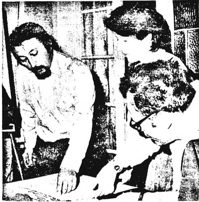
Munkában a team

Április közepén, a harkányi oktatóházunkban egynapos alkotótréningre került sor, melynek célja a jövőbeli üzletpolitikánk alapjainak lerakása volt.