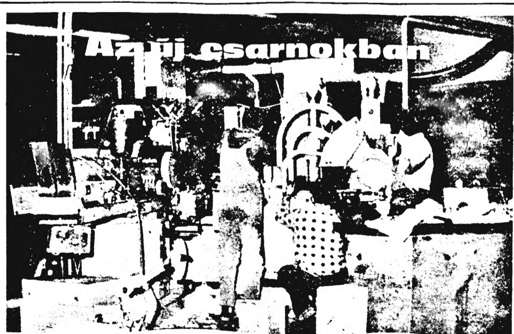
Megkezdődött a gépek átköltöztetése az új csarnokba. Már a helyén áll a 11-es cigarettagyártógép.