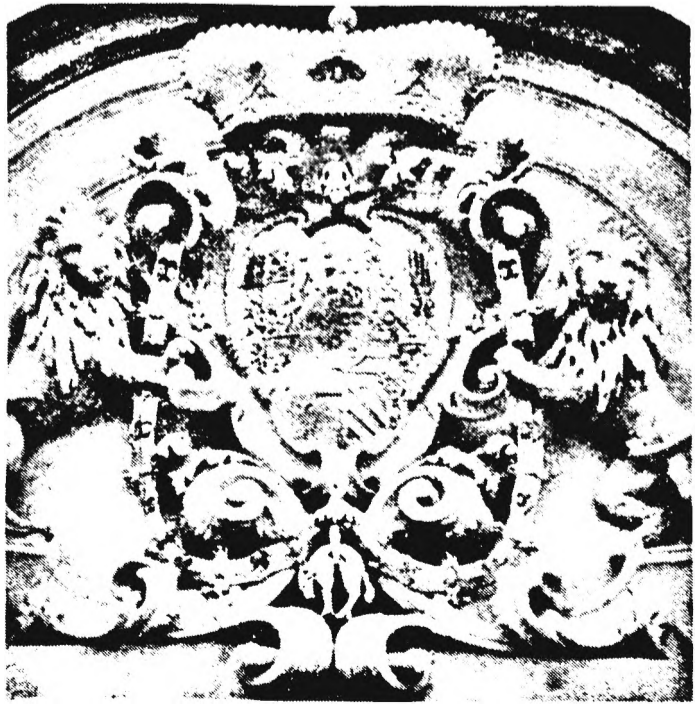
A Savoyaiak címere a Belvedere homlokzatán

pénzét, ezt a hangulatában érdekes piacon tettük meg, arab, török, jugoszláv zöldség- és gyümölcsárak zsebébe