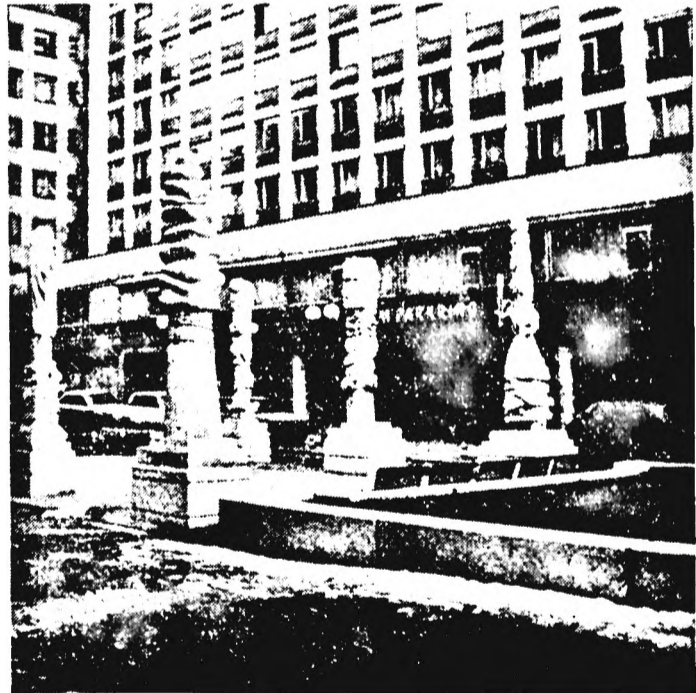
A Parking Hotel bejárata

A szombat délelőtt már a hazafelé készülődéssel telt el, mindenki elköltötte maradék