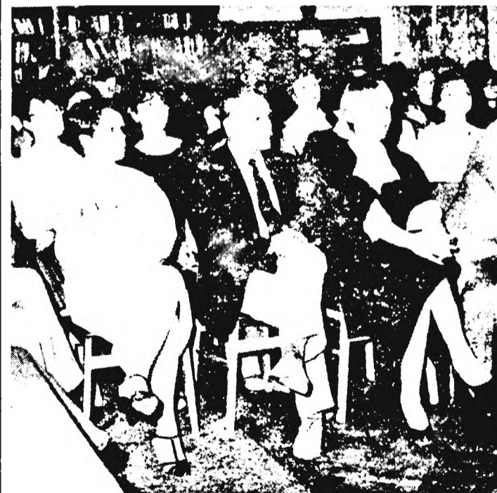
Pillanatkép a vállalati ünnepség résztvevőiről