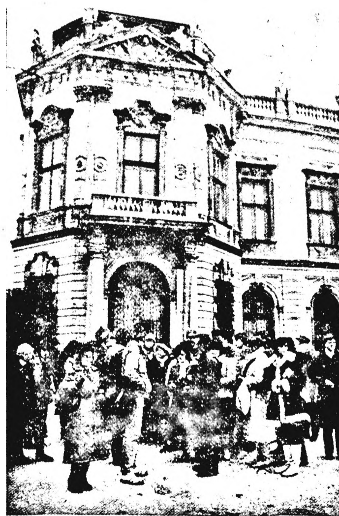
A csoport a Belvedere-palota előtt

Március 6–8-ig vállalatunk dolgozóinak kis csoportja ausztriai-bécsi kiránduláson vett részt. A „Szerviz brigád” brigádvezetőjének szervezésében a Coopourist utazási irodával 22-en indultak az útra.