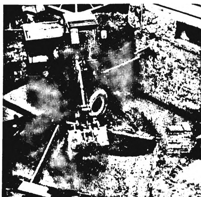
A gyártási épület nyugati oldalánál készül az előkészítési gázhenger új helye