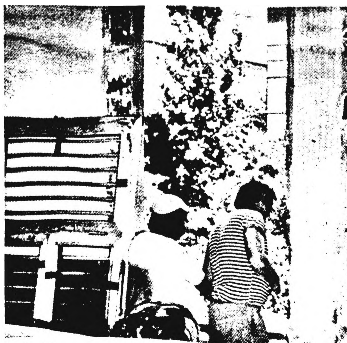
Az óvodában is megkezdődött a régi ablakok kiváltása, helyükbe modern, jó hőszigetelésű ablakok kerülnek

ipari Szövetkezet — tevékenykedik. A Déryné utcai épületben, ahol hajdan az Angster család lakott, ma a szövetkezet irodái vannak, az orgonagyártó üzem emeletes épülete eredeti formájában áll az udvaron éppen felújításra várva. Egyesületünk úgy döntött, hogy a Városi Tanács művelődési osztályával közösen gondoskodik emléktábla elhelyezéséről. Ennek kapcsán javasoljuk: az ipartörténeti emlékként jelentős épületegyüttest részesítsék helyi védelemben.