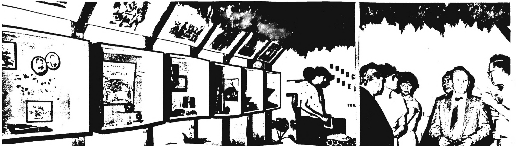
Idén is megrendezték a már hagyományos Pécsi Ipari Vásárt, amelyen számos — közöttük jó néhány külföldi — cég mutatta be új termékeit. Természetesen ott volt a Dohánygyár is a kiállítók között — felvételünk a pavilonunkat mutatja be —, s júliusi számunkban írunk is a vásár érdekességeiről. Bővebben a következő lapunkban olvashatnak majd a Pécsi Ipari Vásárról.