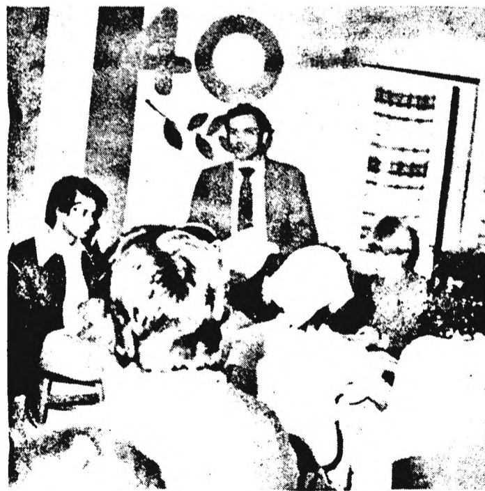
A konyha és gondnokság dolgozói választják küldöttüket a vállalati tanácsba