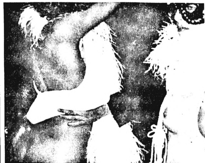
Erre nagyon figyelj: ha tánc közben, annak hevében kezeid össze-vissza járnak, s így összegyűröd a partnerved ruháját, holtbiztos, hogy arra jár majd egy fatós! Neki pedig egyből odaragad a lencséje. Nem jó ez senkinek, a feleségednek is a kezébe kerülhet a kép. Utána meg Te...