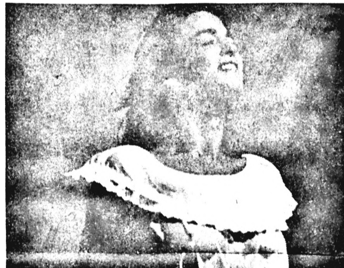
Ha túletted magad, feltétlenül pihegy egy hangyányit, meglátod: csodájára járnak majd, hogy Te milyen figyelemre méltóan műveled a pihegést.