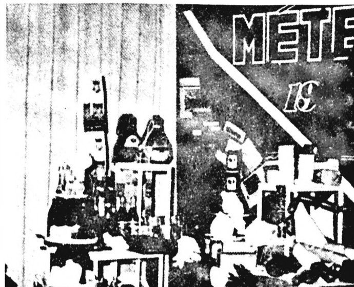
Ha nincsen pénzed, feltétlenül a MÉTE-bálba menjél! Ott ugyan is a tombolán kaját és piát is nyerhetsz, sőt, még Te vagy a szerencsés fickó — egy fillér nélkül. (A tombola ára ma már semmit sem ér...)