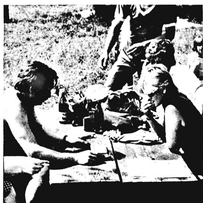
Juniálisan rendezett a Pécsi Dohánygyár a Malomvölgyben. A színes, programokban gazdag napról lapunk 4. oldalán olvasható tudósításban számolunk be.