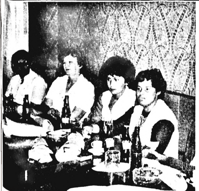
minden évben, idén is köszöntöttük pedagógusainkat. Később a legjobb jutalmat kapták.