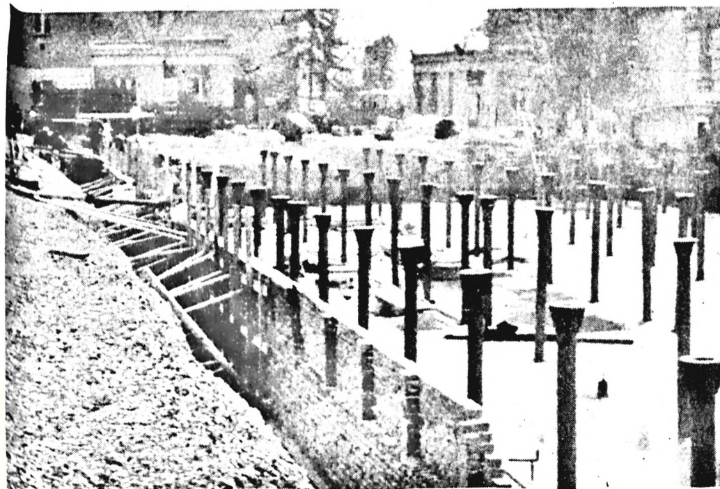
16 Ütemben halad az új csarnok építése, s már állnak a fő tartóoszlopok.