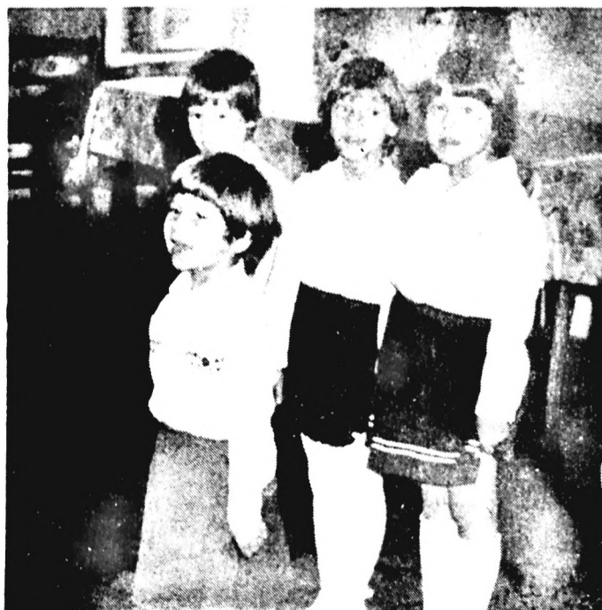
Műsorral kedveskedtek az ünnepség résztvevőinek vállalatunk övodásai