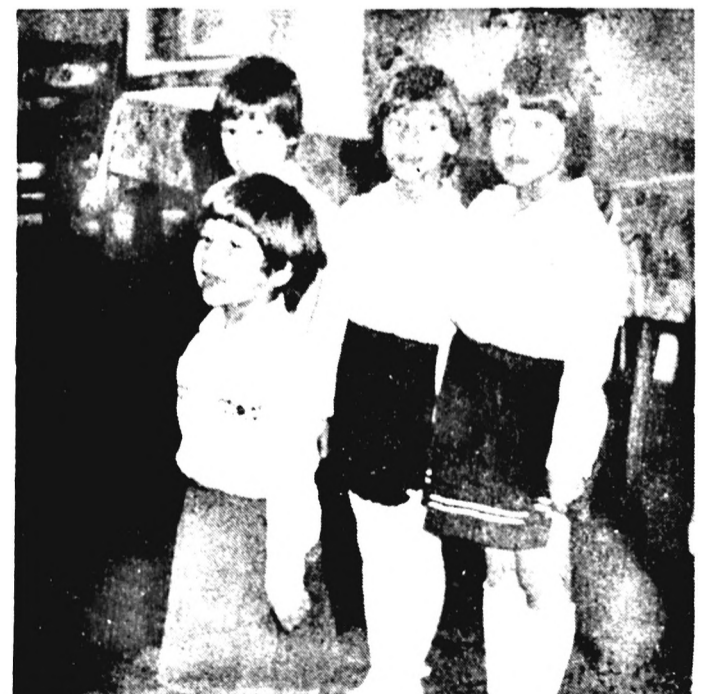
Műsorral kedveskedtek az ünnepség résztvevőinek vállalatunk övodásai