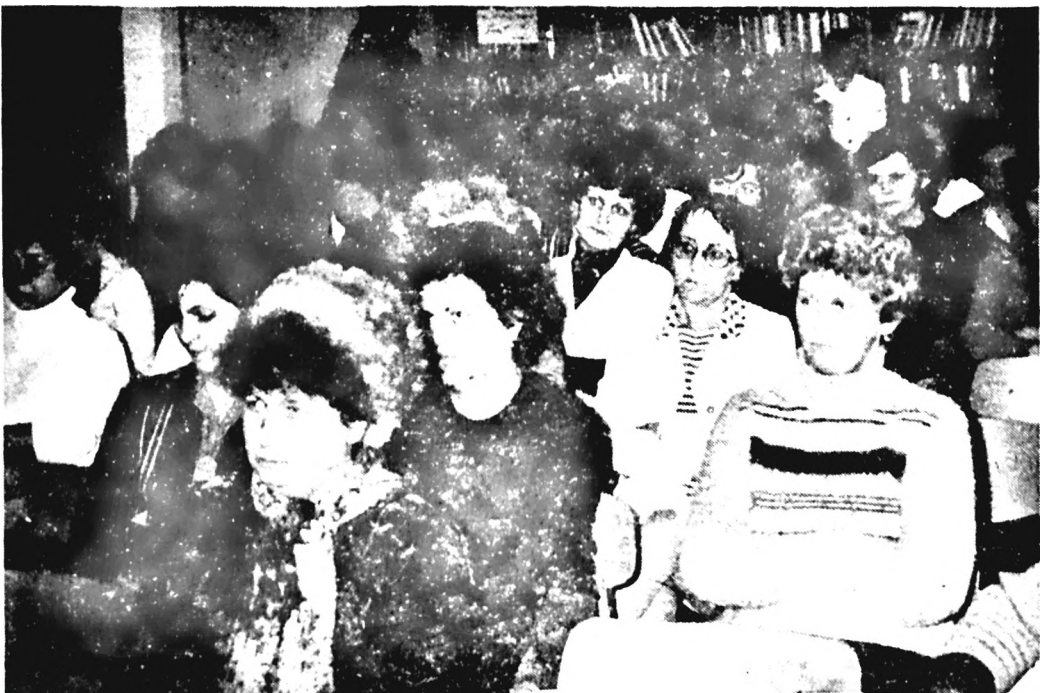
A nyilvános pártnap hallgatóságának egy része