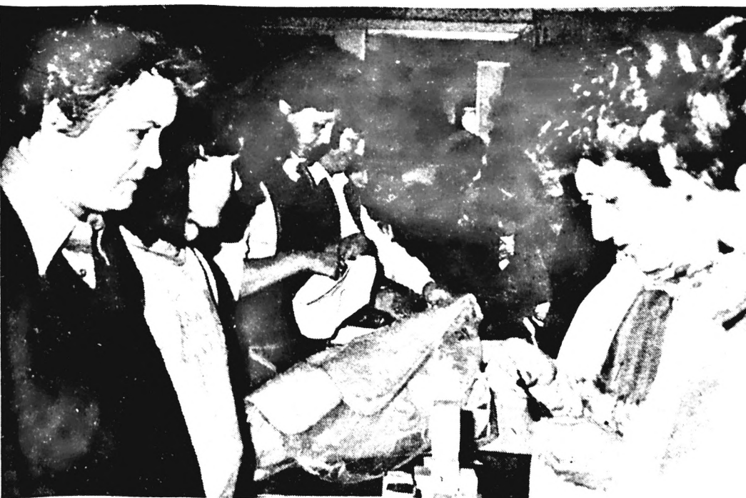
Ismét Centrumvásár volt gyárunkban, november 16-án, a tornateremben. A korábbi sikereken, az eredményes vásárlás lehetőségén felbuzdulva megint csak nagy volt az érdeklődés, különösen az olcsó takarók akadtak gyorsan vevőre.