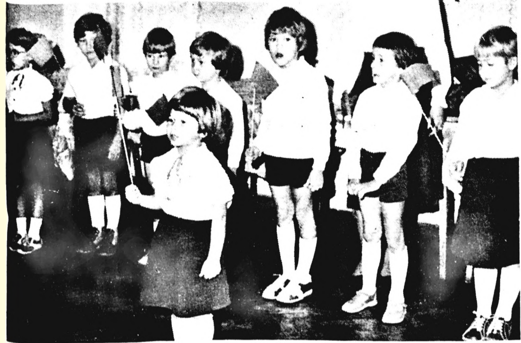
Műsorral léptek fel gyárunk óvodásai — s arattak ezzel megérdemelt elismerést — a november 7-ét köszöntő ünnepségünkön