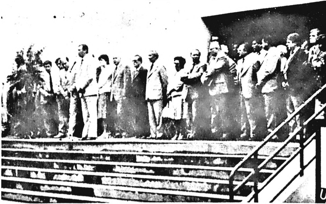
Pillanattfelvétel a Pécsi Ipari Vásár ünnepélyes megnyitójáról