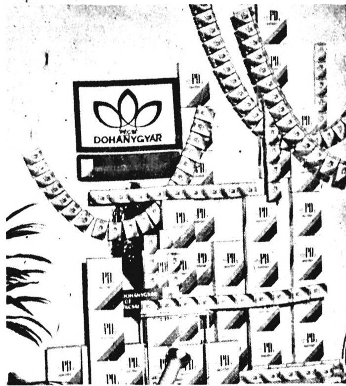
Ízléses „találásban” ismerkedhettek a vásárlatógatók a sikert aratott PD-családdal

segíjtek. Továbbhaladva a folyosón, láthatunk még a Bm.-i Tejipari Vállalat, a Bm.-i Gabonafőzési és Malomipari Vállalat és a Szabadegyházi Szeszipari Vállalat termékeit bemutató pavilonokat. Az első