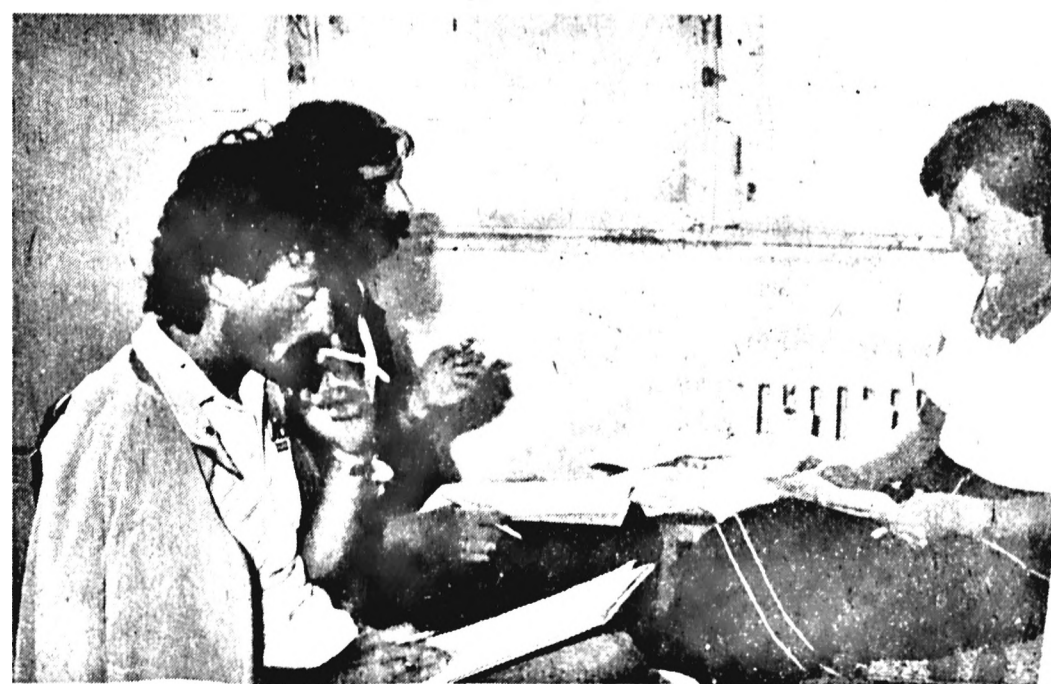
Jó ötletnek bizonyult a próbaszívás, ennek révén közvetlen észrevételeket kaphattunk a fogyasztóktól

A hazai szállítók többsége újdonságot hozott és mutatott be a vásár látogatóinak. A Jókai utcai iskolában állított ki a magyar könnyűipar sok jeles képviselője. Kiállításukat végignézve, azonban a vendégek többségét az foglalkoztatta, hogy vajon csak a termékek, melyek szépek, praktikusak, mikor lesznek megvásárolhatók, illetve, hogy a közeljövőben v. szontlátják-e őket a boltok, áruházak kirakataiban? Nemcsak ebben a pavilonban, hanem a különböző méretű fogyasztószekrényeket bemutató teremben is a vásár látogatóinak szinte azonnal az jutott az eszébe, hogy csak hiánycikk, és hogy már milyen régóta szinte csak bemutatók őket... Az élelmiszeripari vállalatok a Köztársaság téren lévő „A”