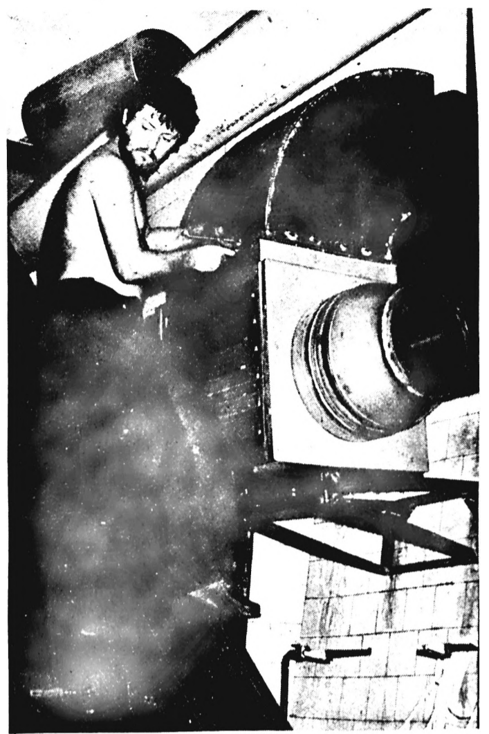
Dolgozóink hosszú ideje panaszkodnak az előkészítési terem nyugati részén tapasztalható magas hőmérsékletre és páratartalomra. A leállás alatt beépített szellőzőberendezés — ha végleg nem is oldja meg — talán enyhít a gondokon. (Tudósítás a 2. oldalon).