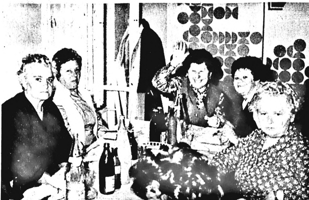
Hagyományos már vállalatunknál a nyugdíjas-találkozó. Örömmel várjuk és örömmel fogadjuk a gyár régi dolgozóit, abban a meggyőződésben, hogy nekik is kellemes perceket okoz régi kollegáikkal meghitt, oldott hangulatban találkozni. E remény jegyében rendeztük meg ebben az évben is a találkozót, amelyre csaknem nyolcvan jöttek el. (Tudósításunk a 3. oldalon).