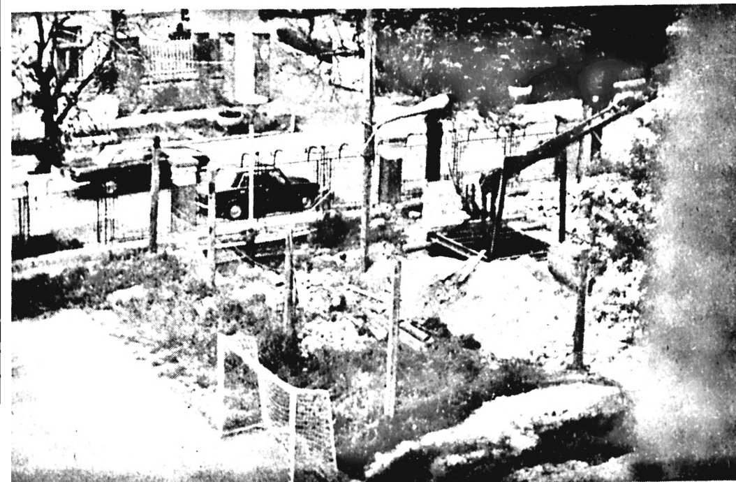
Forróvíz-távezeték építése folyik gyárunk területén. A kerítéssel elzárt területen folyó munkálatok meglehetősen „feldúlták” udvarunk látképet. Sajnálatos lenne, ha az új foci pályánk is végül „áldozatul” esne az egyébként közérdekű építkezésnek.