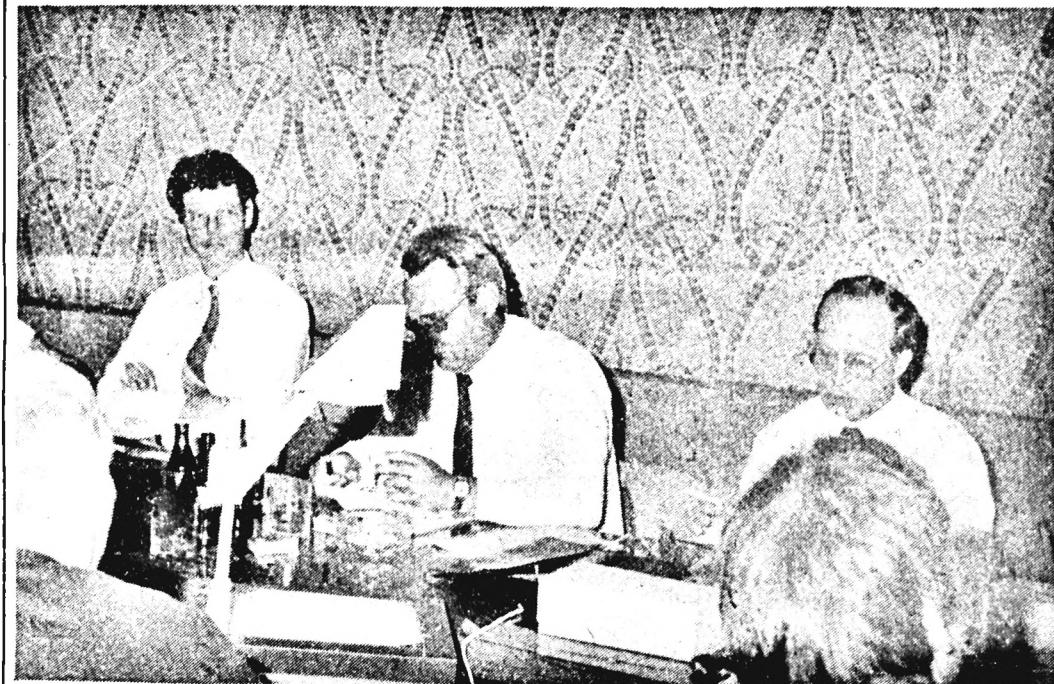
A „Rhodia” acetátkábel gyártó cég képviselői előadás keretében (felső kép) mutatták be gyárunk termékeit és technológiáját, az acetátkábel gyártását és felhasználását.

E szűfolt program után, az esti órákban érték vissza Pécsre.