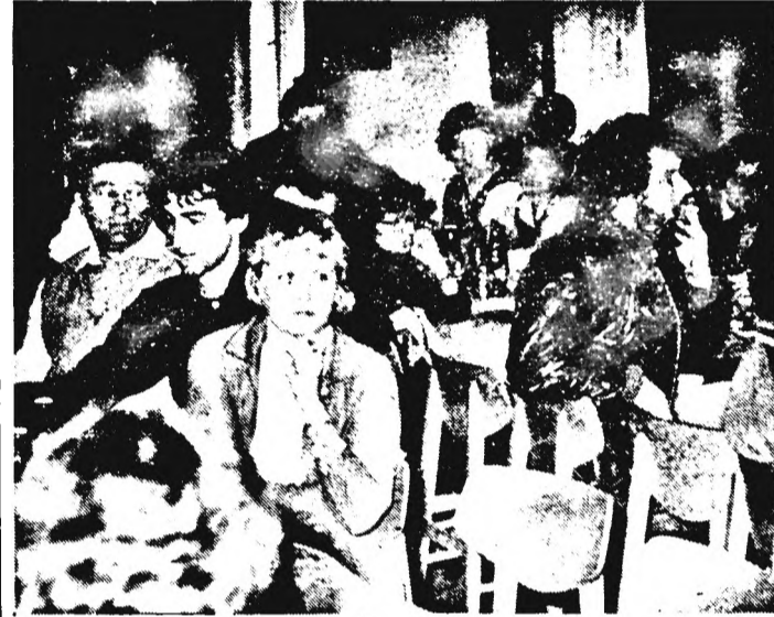
Pillanatfelvétel a szocialista brigádvezetők tanácskozásáról

Volt olyan hozzászóló, aki a visszaesés okát abban látja, hogy ragaszkodunk a régi formákhoz, ma is azt várjuk a brigádoktól, amit 20 évvel ezelőtt.