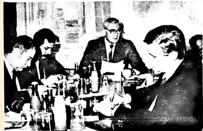
A miniszterhelyettes munkaértekezleten adott tájékoztatást a dohányipar vezető szakembereinek.