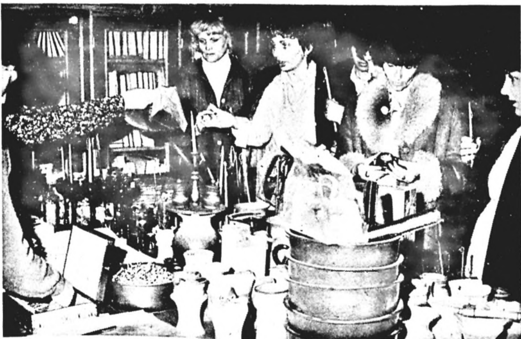
Siker karácsonyi ajándékozást segítő vásárlási akció volt gyárunkban. Választék volt, a gondolat inkább az jelentette: kinek mi legyen az „igazi”...