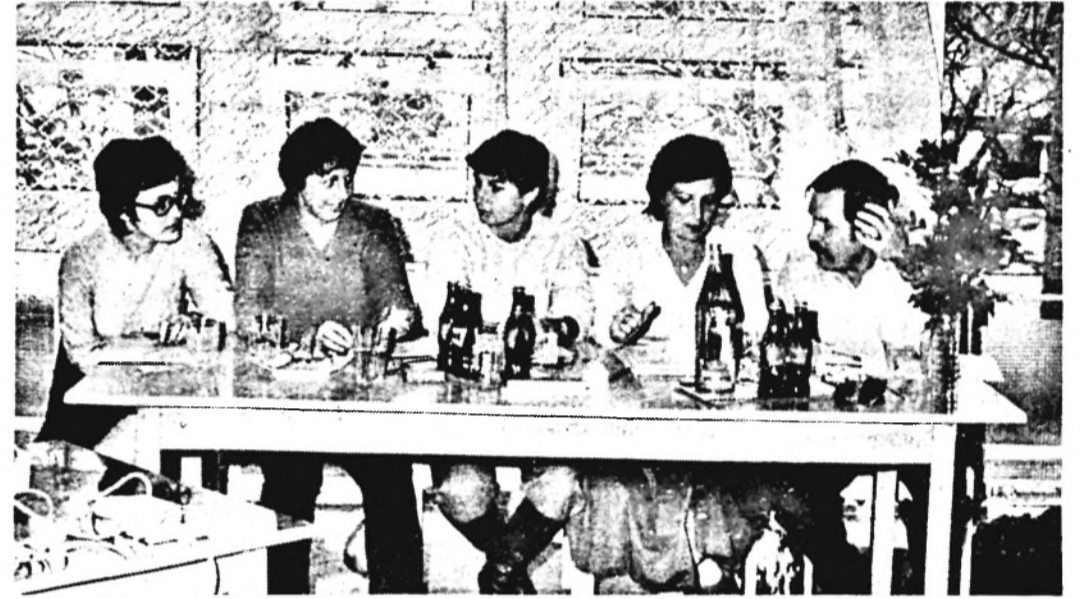
A Pécsi Dohánygyár csapata

A műveltségi fordulóban nem csak a tudás, hanem az ügyesség is szerepet játszott. Minden csapat 50 pontot kapott, ezzel kellett „gazdálkodni” és az egyes kérdésekre licitálni. (Eppen úgy, mint a rádióban a „Senki többet harmadszor!” szellemi árverés játékaiban.) Aki a legtöbbet ígerte a kérdésre, az kapta meg a válaszolás jogát. Talán ez a forduló volt a legnehezebb, hiszen erre nem tudunk készülni. Rövid részletek alapján kel-