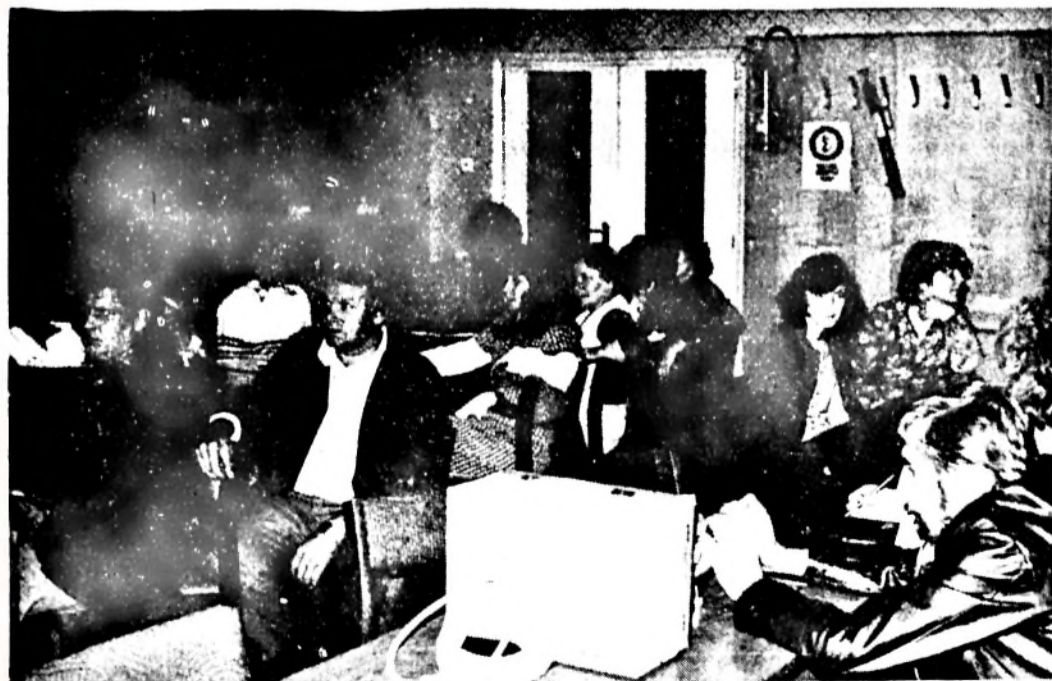
Az üzemi balesetek megelőzésének egyik fontos eszköze a rendszeresen ismétlődő munkavédelmi oktatás. Felvételünk az október-november hónapban lebonyolított nem fizikai állományú dolgozók oktatásán készült.

Fogadjuk meg, hogy munkánk további javításával, szocialista vívmányainkat megőrizzük, és elkötelezetten harcolunk a béke megőrzéséért. Ha sikerül a békét megőrizni és hazánk, ezen belül városunk fejlődését biztosítani, akkor a hősök nem haltak meg hiába!