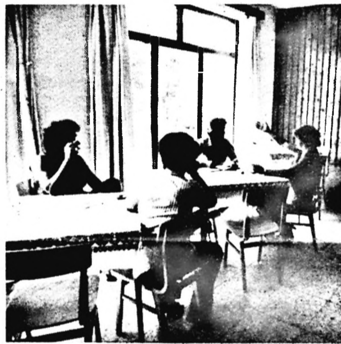
Az ebédlő egyúttal kellemes társalgó is

Mindketten egyöntetűen állították, hogy nagyon szíves fogadtatásban volt részük, szívesen jönnek ide máskor is. A gondnok nem tesz különbséget a vendégek között, nekik olyan volt, mintha haza jöttek volna.