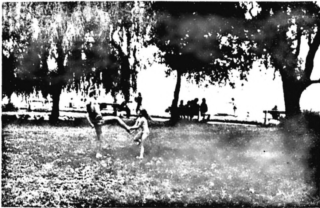
A strand árnyas fái alatt