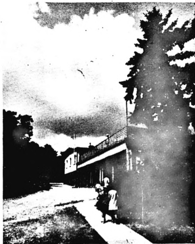
A kapun belépve kellemes látvány fogadja az érkezőket