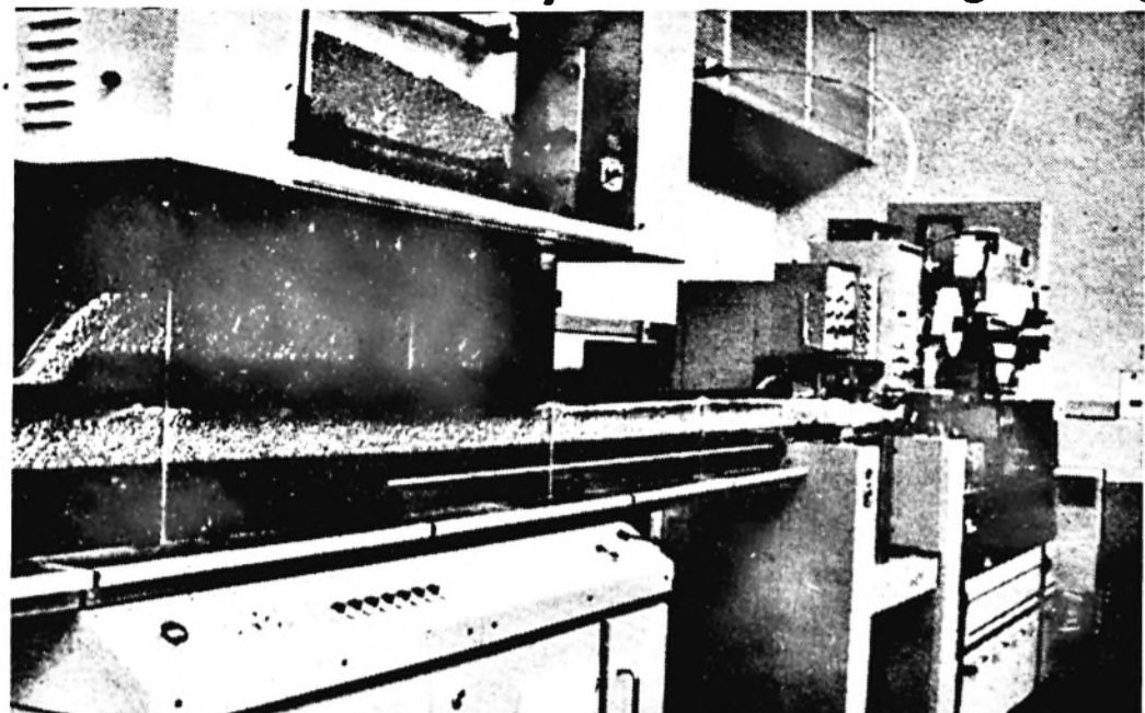
A PRQTOS gépsor egy része a hamburgi kiállításon.