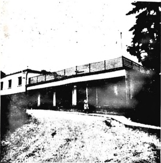
Az üdülő egy része, előtérben az ebédlő üvegablakai