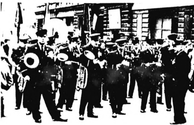
Amikor a felvonulónk élén saját zenekarunk haladt...