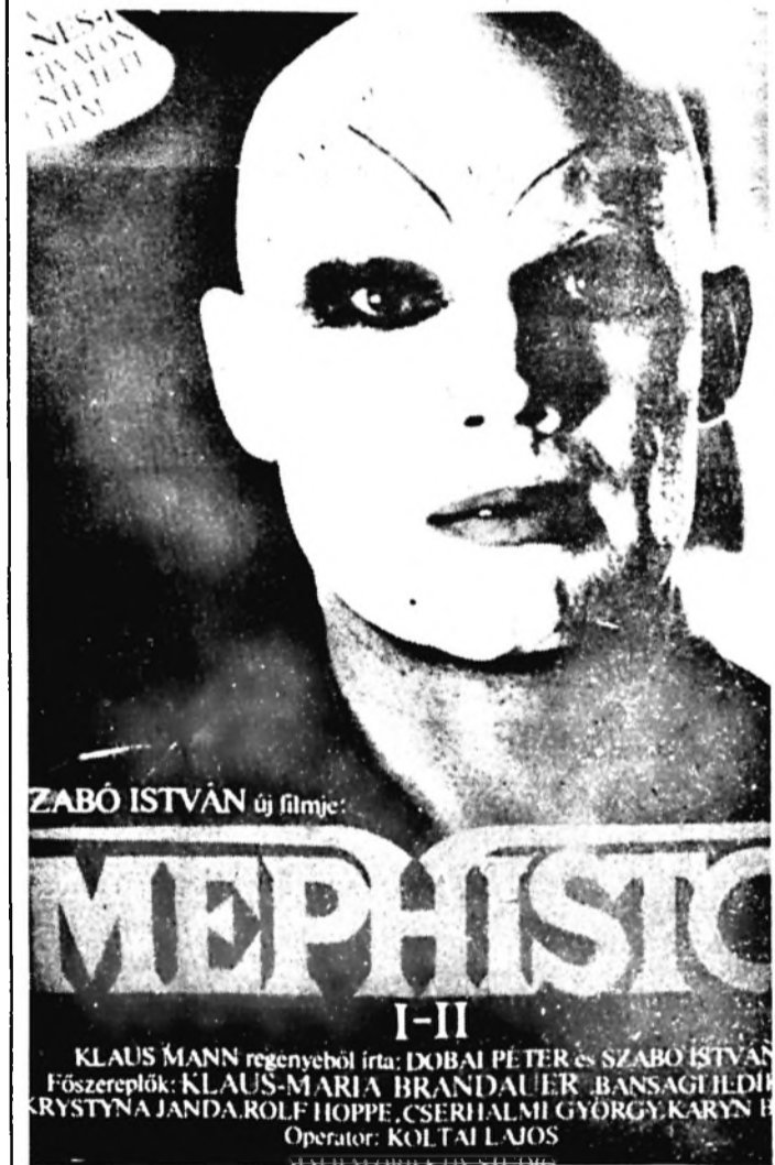
Oscar-díjra jelölték Szabó István filmjét, a Mephistót

gépei közül már jó néhányat leszállított az állvállalkozó, ezek üzembehelyezésére azonban mindaddig nem kerülhet sor, míg a dohányvonal első szakasza megbízhatóan nem üzemel. Számos nyitott kérdés van még az egész technológiai sor mikéntjéről, illetve, ez ezekre felelős döntés még nem született.