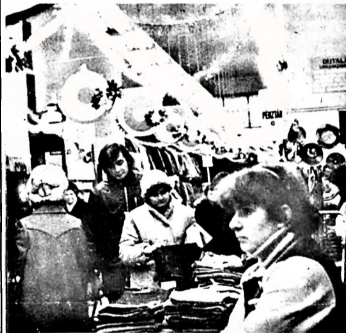
Nagyüzem a pécsi Centrumban