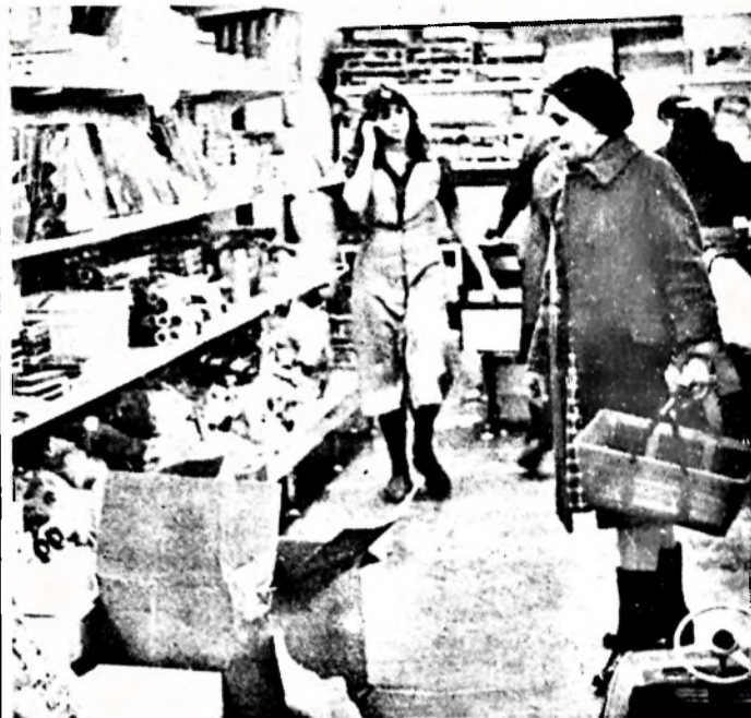
Gondban a nagymama...