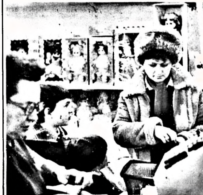
En választottam — anyu fizet!