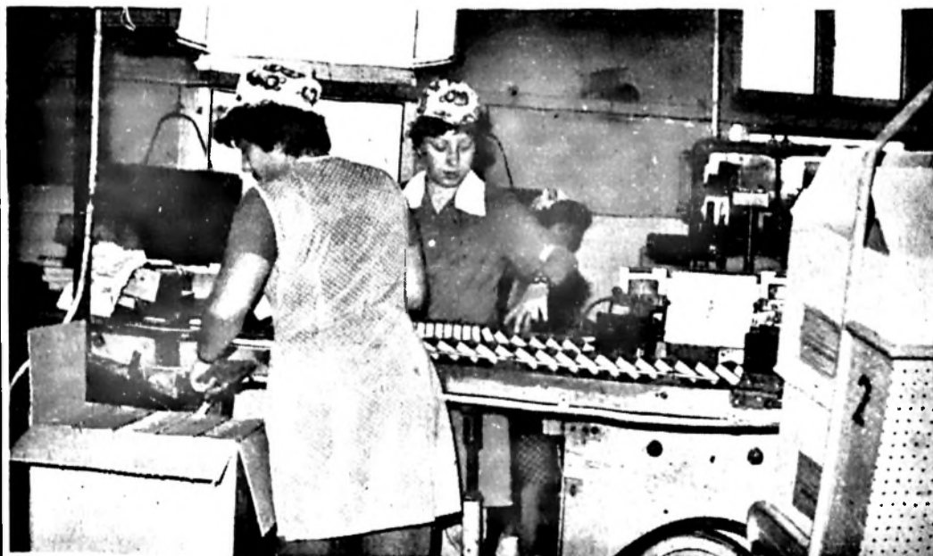
Dolgozóink vállalásuknak megfelelően, ebben az évben másodszer teljesítették sikeres társadalmi műszakot. Az október 24-i kommunista műszak termelése 18 millió 720 ezer darab cigarettára volt. A munkaidőn túli termelésért járó bért dolgozóink a saját gyermekintézmények fejlesztésére ajánlották fel. Képünkön: az I. műszak dolgozói a csomagolásban.