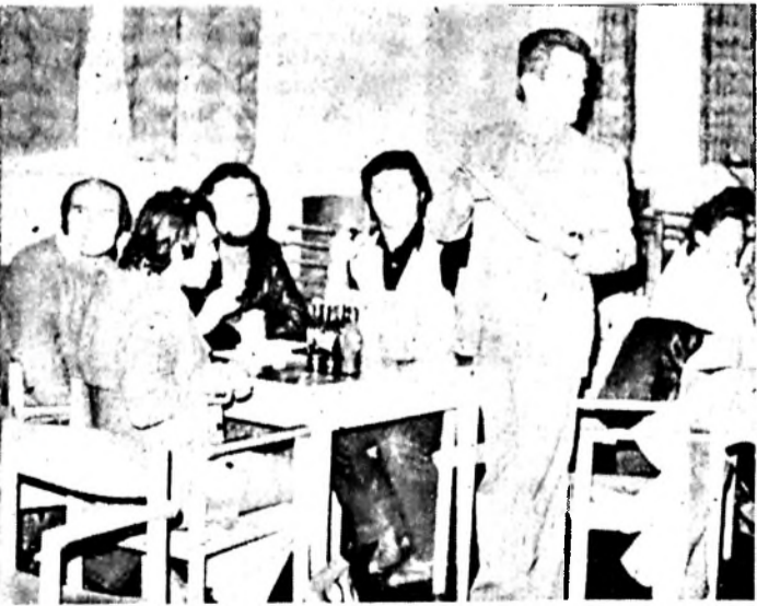
Versenyben az 1. helyezett „Lendület”

1981. november 11-én a Doktor Sándor—Zsolnay Művelődési Központban rendezték meg a városi szintű „Munka és művelődés” vetélkedőt, a népművészet, néprajz témakörből.