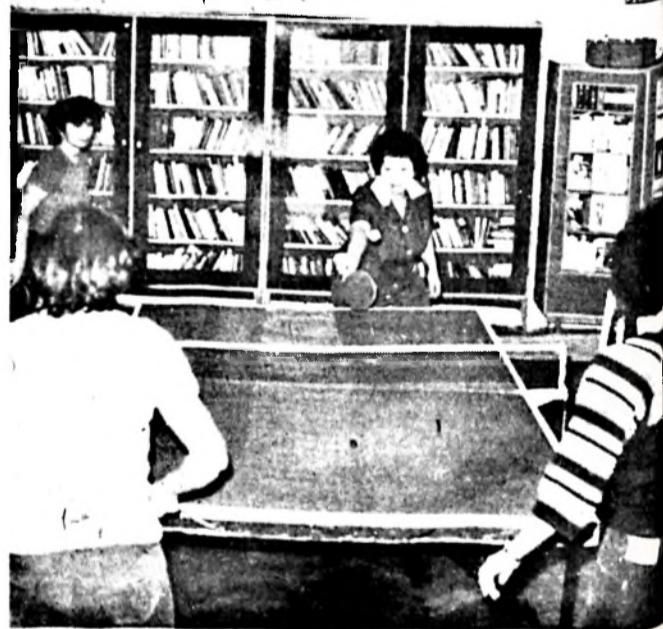
A szakszervezet rendezte házi verseny résztvevőinek egyik mérkőzést.

Házi asztalitenisz-bajnokság. November elejétől jelentős sportesemény zajlik a Pécsi Dohánygyárban. A vállalat szak- szervezetei bizottsága november- ben rendezte meg a házi aszta- litenisz-bajnokságot. A dolgozók körében ritkán látott nagy ér- deklődés előzte meg ezt a sporteseményt, amelyet a vál- lalati ebédlőben bonyolítanak le. A versenyek két héten ke- resztül folynak, délutánonként. A résztvevők számára igazán kedvező lehetőség nyílik sport- talási igényük kielégítésére. Az asztalitenisz-bajnokságon a kö- vetkező számokban indulhatnak a versenyzők: