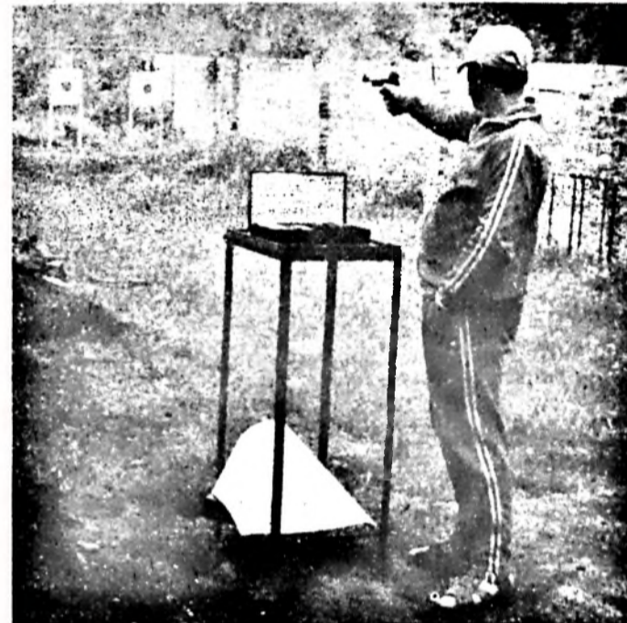
Lövészetben. A zsebre dugott kéz itt nem illetenség...