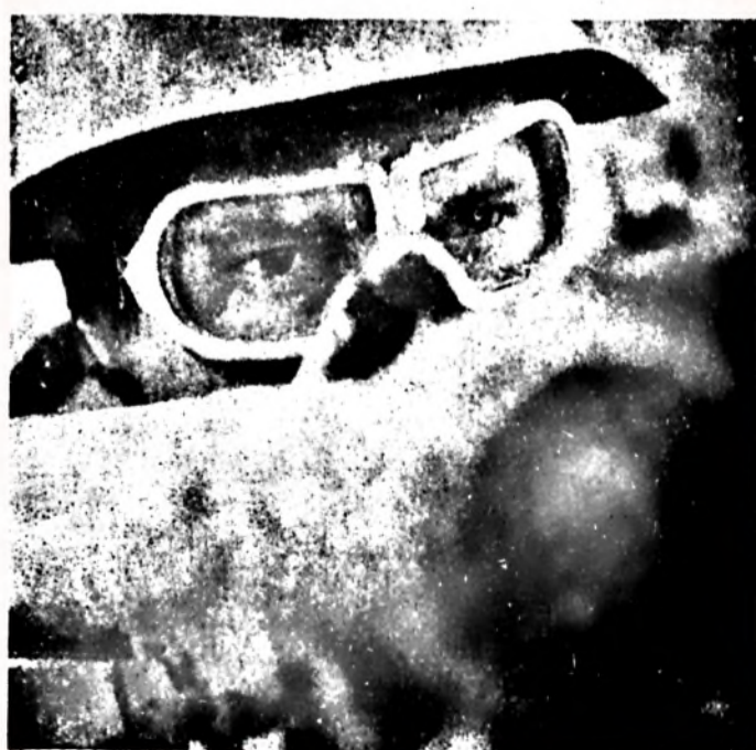
A páncélfelhárító fegyver már csak a tényleges katonák kezébe való