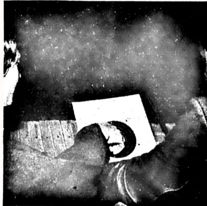
Ez bizony egy tizes!