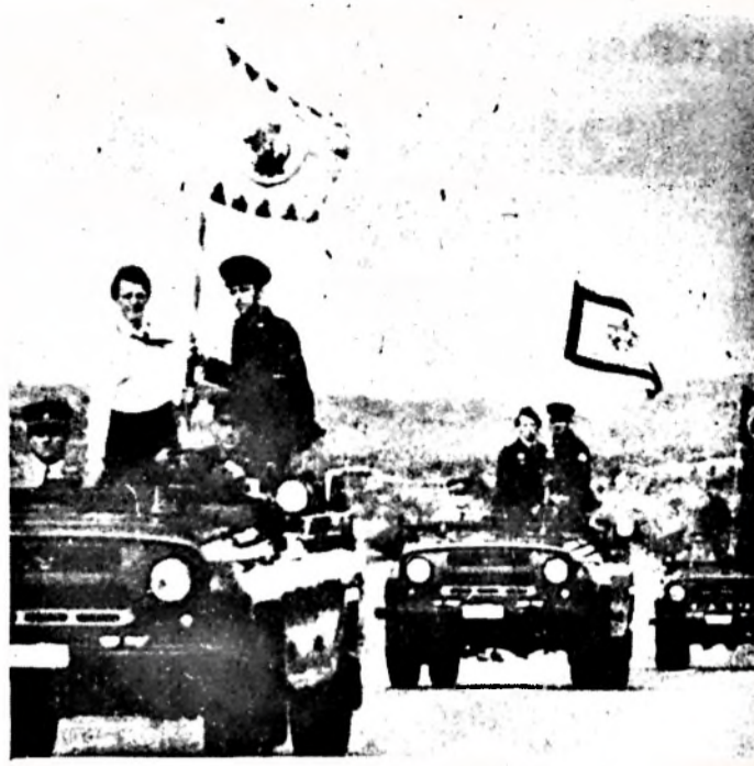
Pákozdnál kezdődött... Felvonulás az évfordulón az 1848-as szabadságharc zászlóival.