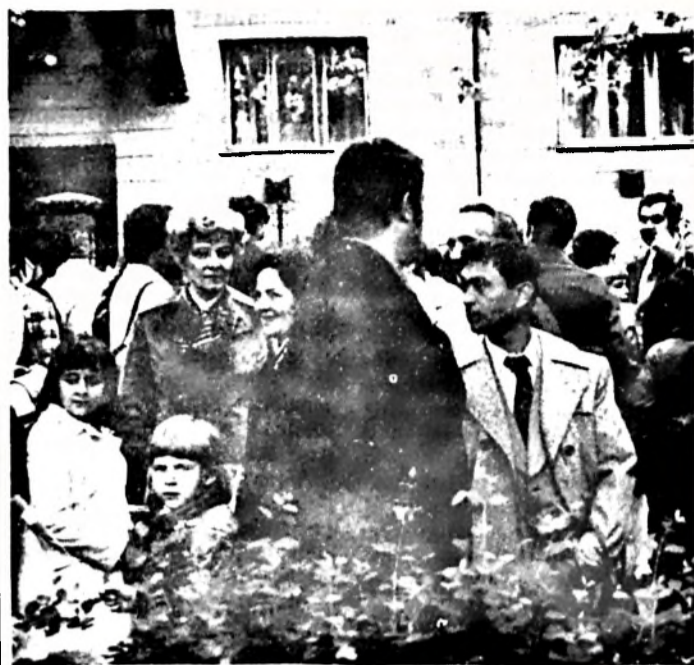
Gyülekezéskor együtt volt a gyár apraja-nagyja