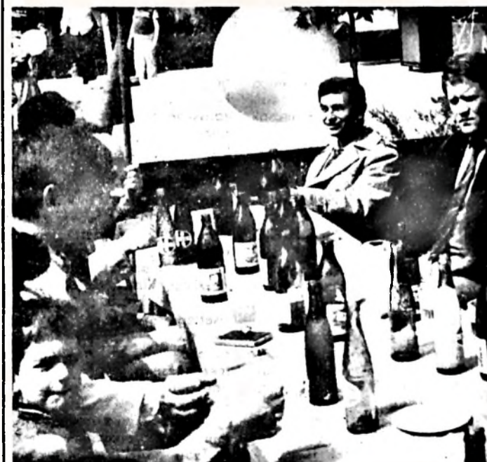
A hagyományokat őrizni kell, s ehhez a naphoz mindig hozzátartozott a barátai találkozó, a beszélgetés