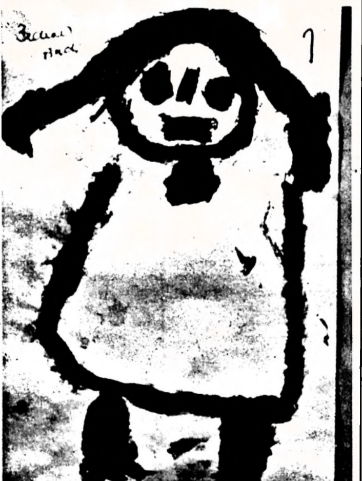
Vass Szilvia (5 éves) festménye: A legjobb barátom