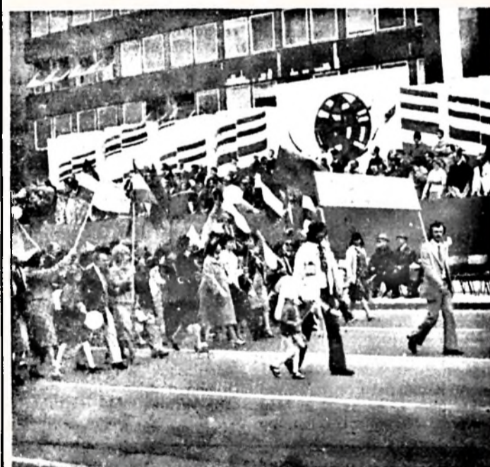
A Kiváló Vállalat címet elnyert gyárunk dolgozói a disztribúción éltek