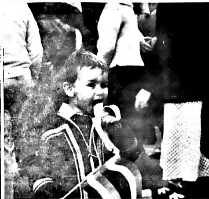
A kellemeset a hasznossal...