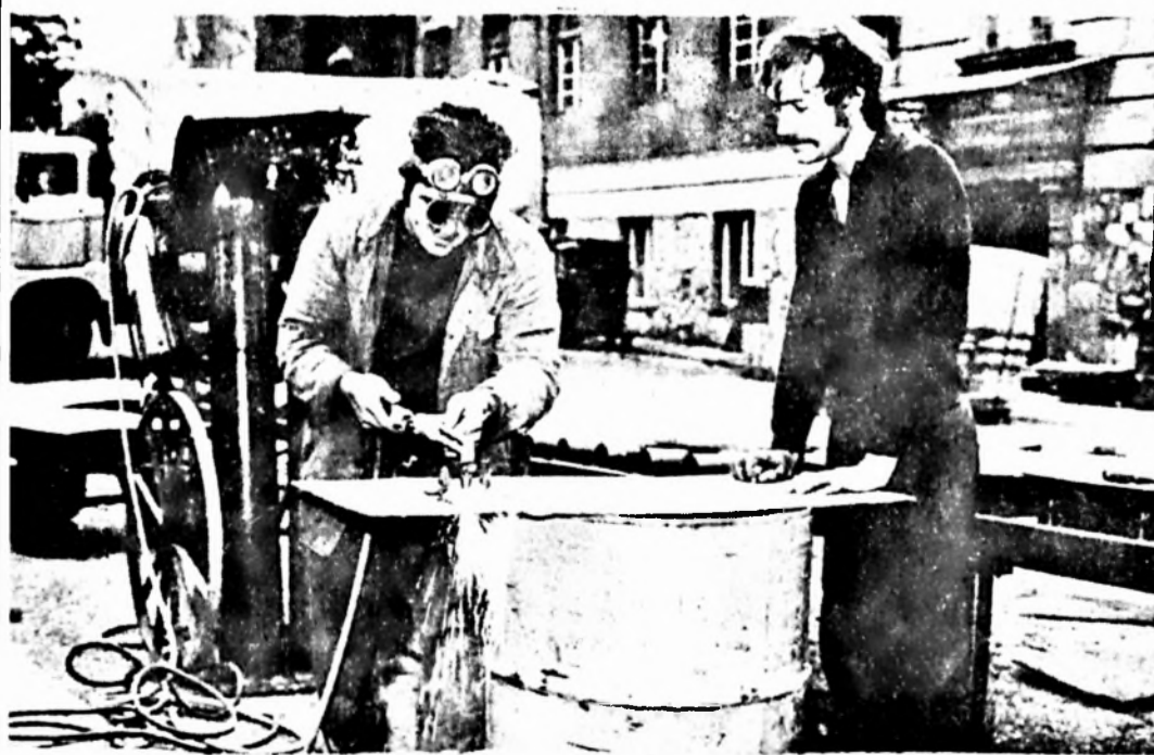
Korszerűbb és ezért lényegesen jobb munkakörülményeket biztosító lesz a keveréktároló siló is. Képünkön a szakemberek a siló lépcsőfeljárójához szükséges anyagot darabolják.