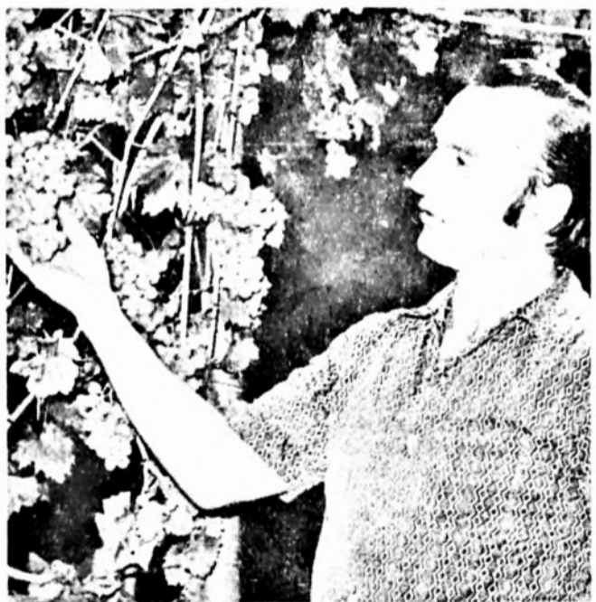
és a láthatóan elégedett tulajdonos.