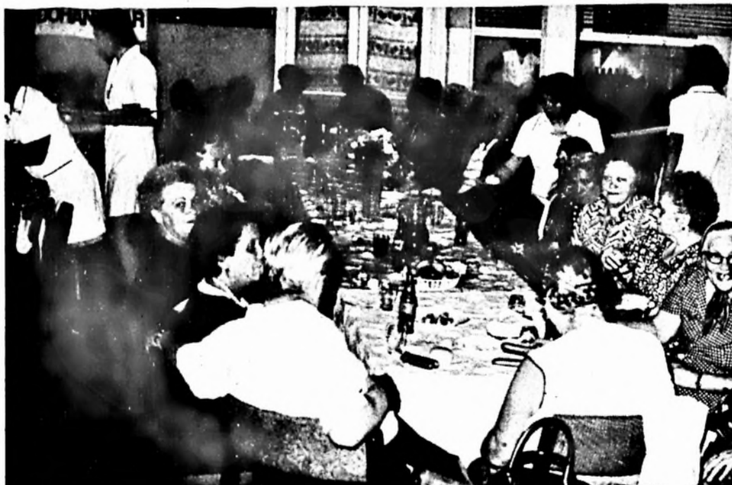
Nyugdíjasnap volt gyárunkban. A hangulatos, sok régi dolgozónak örömet szerző rendezvényről képriportban számolunk be a 3. oldalon.