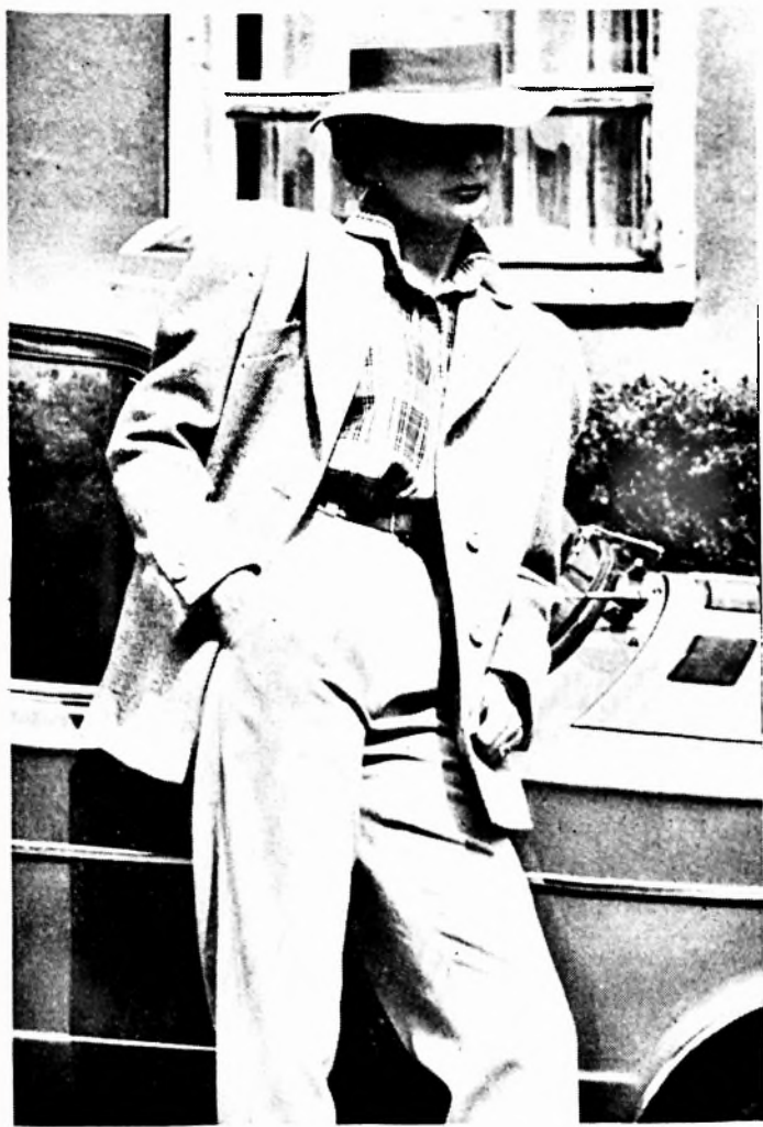
Sportos összeállítás: kihangsúlyozott vállú, egyes vonalú zakó gabardin nadrággal, Kockás zefiring egészíti ki. Utazáshoz, autózáshoz divatos, kényelmes viselet. Tervezte: Vörös Irén