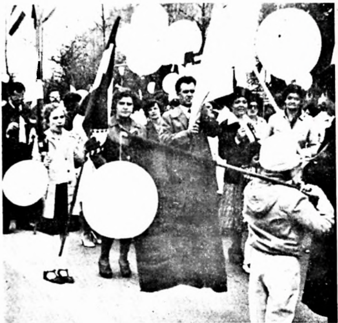
Együtt a dohánygyáriak, felnőttek és gyermekek, zászlókkal, légöngömbökkel