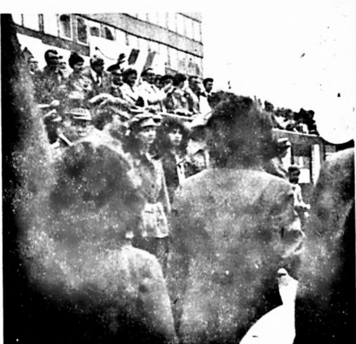
A diszemei élelmiszeripari a megye és a város vezetői üdvözlik a felvonulókat