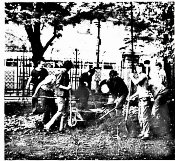
A „Szerviz”-brigád a labdarúgó-pálya felújításán dolgozik.

— Megkezdődött az ÉDOSZ kispályás labdarúgás a Kinizsi-pályán. Csapatunk szereplését az első két fordulónak nem kísérelte szerencse. Eredmények: Dohánygyár—Sörgyár 0:3, Húspipar—Dohánygyár 3:0.