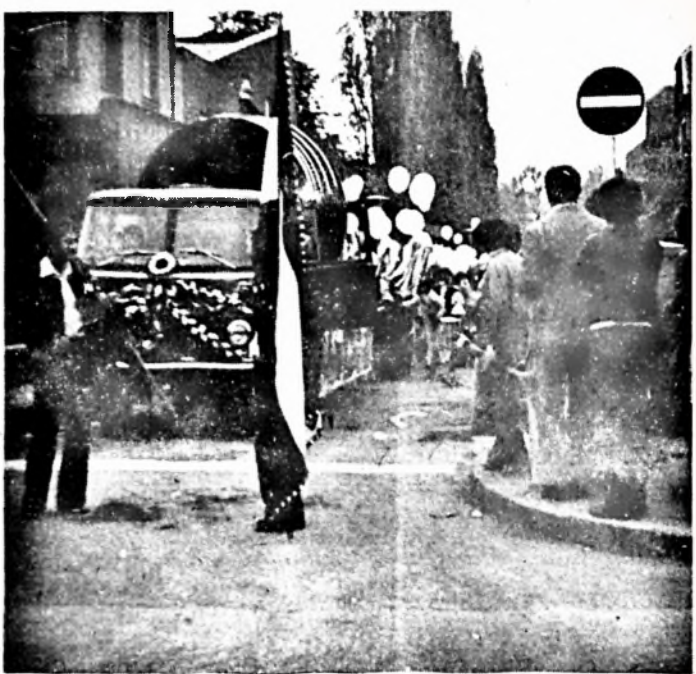
Az élelmiszeripar „tekintélyes” hordója...