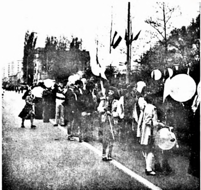
Az indulásra várva