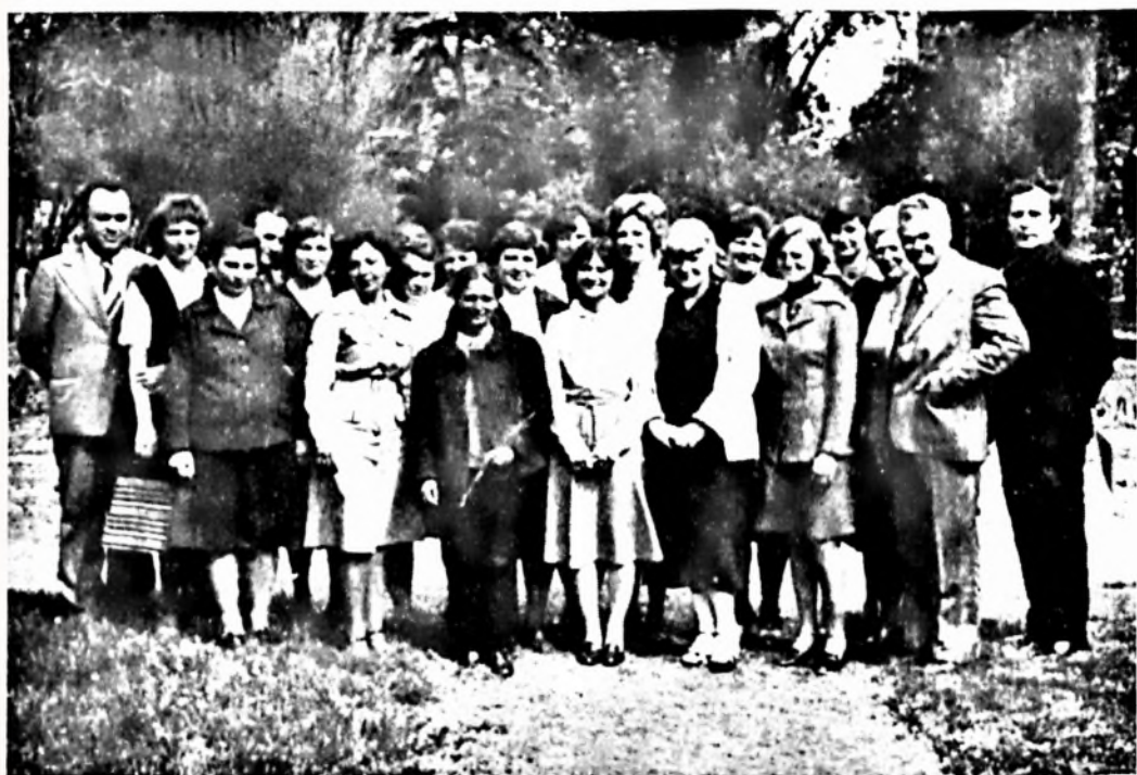
Új szakmunkásaink és a vizsgáztató bizottság

— Gondoskodjunk a feleslegessé vált göngyölegthalmazok eltüntetéséről, fásításról, virágok ültetéséről, és azok folyamatos gondozásáról, ápolásá-