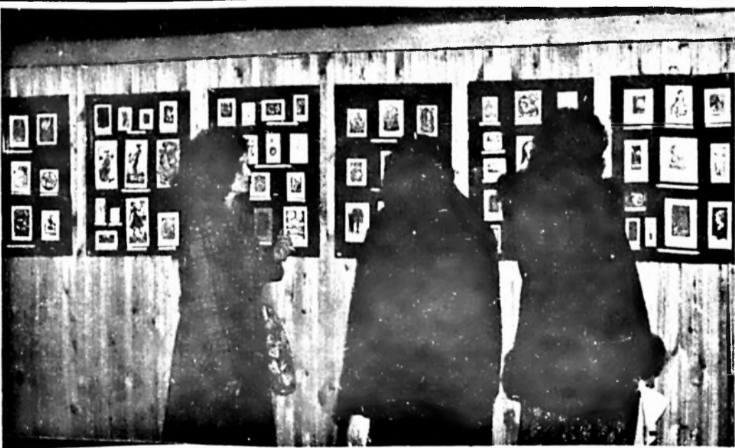
„Nő a kisgrafikában” címmel 57 művész több száz alkotását mutatta be az a kiállítás, melyet a 70. napon tiszteletére rendezett vállalatunk III. sz. KISZ-alapszervezete, az Ifjúsági Klubban. A kiállítást megtekintő mintegy 300 dolgozó elismerően nyilatkozott az izléses és gazdag anyagról.

Pécsi Szikra Nyomda 7630 Pécs, Engel János u. 8. F. v.: Szendrői György