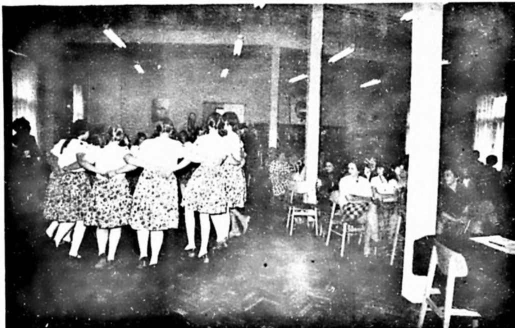
Néptáncbemutató az ünnepségen